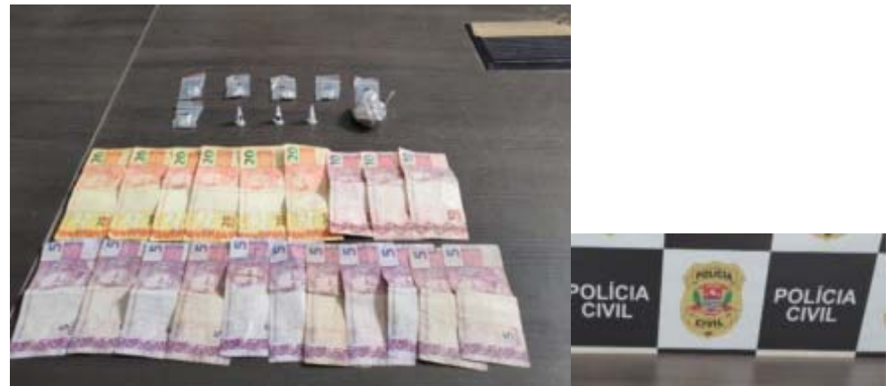
Rotina de apreensões de droga e dinheiro e de prisões das pessoas envolvidas com o tráfico segue intensa na especializada

do para a sede da DISE/DEIC, onde foi preso em flagrante por tráfico de drogas. Encaminhado para uma unidade prisional, ficou à disposição da Justiça.