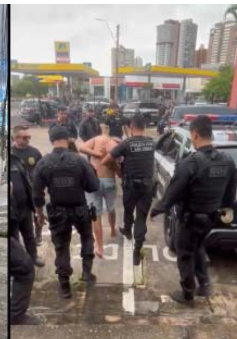
Integrantes de perigosa organização criminosa acabaram presos numa operação histórica