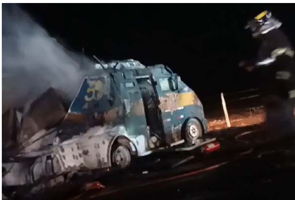
Ataque a carro-forte em Restinga (SP) resultou em confrontos com mortes e prisões pontuais, que ajudaram no esclarecimento do caso