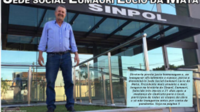
Diretor da polícia faz homenagem e, em inauguração oficial, inaugura a sede social da Sinpol. Presidente embaixador e mais longos na história do Sinpol. (Continuará) Faltam dois meses e 21 dias para a inauguração de uma nova sede social, participação de todos os estados da obra e se não inaugurar antes por conta de pandemia. Leia na página 03.