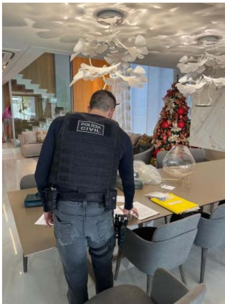
Alguns integrantes da quadrilha levavam vida luxuosa e foram presos em imóveis de alto padrão