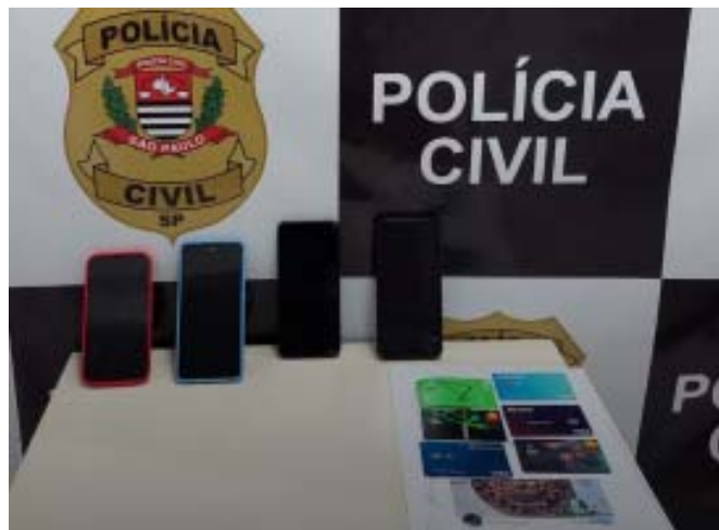
Golpistas que anunciavam falsas peças de antiguidades pelas redes sociais foram surpreendidos pela Polícia Civil na região

Ação ocorreu para desarticular golpistas que, através de um falso perfil em rede social, lesavam interessados em antiguidades