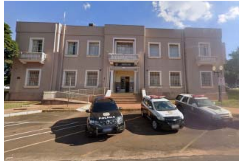
Agindo rapidamente, policiais civis de Jaboticabal esclareceram tentativa de feminicídio e prenderam suspeito

Policiais civis do SIG e da DDM conseguiram identificar e prender homem que teria tentado matar mulher