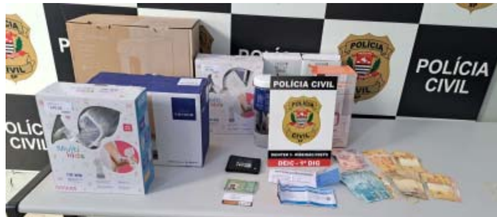
Durante prisão de mulher que roubou deficiente visual, produtos do crime foram localizados e recuperados pela Polícia Civil

dos no apartamento foram apreendidos. As investigações prosseguem para identificar os outros integrantes da quadrilha.