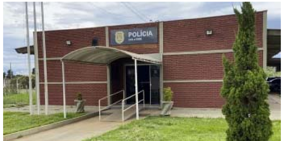
DIG Bebedouro coordenou investigações e policiais cumpriram mandados de busca em Ribeirão Preto e Guariba

Por: ACS - Delegacia Seccional de Polícia de Bebedouro, com adaptações