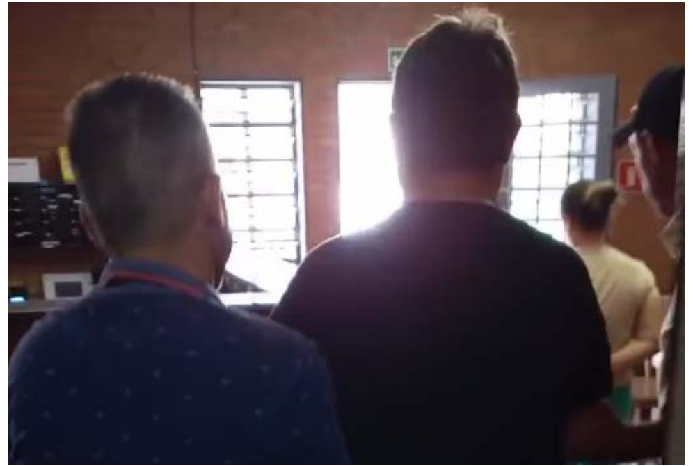
Falsos agentes da Receita foram presos em hotel de Ribeirão Preto; grupo havia extorquido idoso de Jaboticabal

Os policiais civis apreenderam uma camionete, celulares, documentos falsificados e outros veículos. A Justiça de Goiás foi notificada da prisão dos procurados pela Interpol.