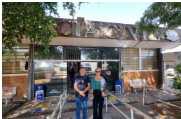
Acima, a partir da esquerda, na Delegacia de Descalvado e, nas duas seguintes, na Seccional de Casa Branca; na foto ao lado, à esquerda, na Delegacia de Porto Ferreira e, na foto à direita, na Delegacia de Santa Rita do Passa Quatro