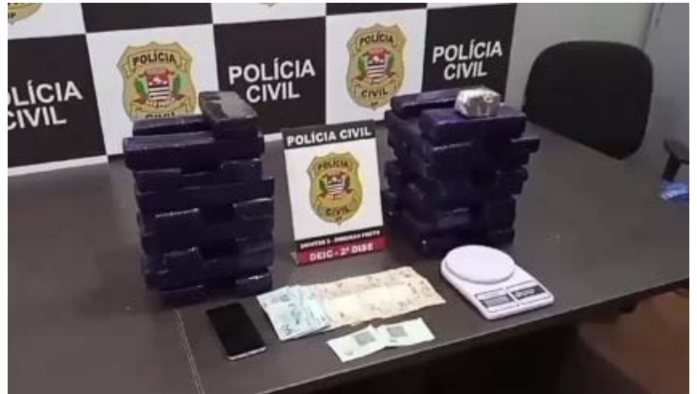
Líder de facção criminosa foi outro teve grande prejuízo e acabou preso

Os policiais chegaram até ele após investigar denúncia de um homem que utilizava um veículo vermelho e estaria vendendo grandes quantidades de drogas na região do Valentina Figueiredo. Agentes da Delegacia