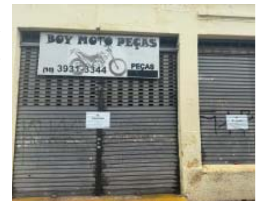
Revenda de peças usadas foi lacrada durante operação

A força-tarefa também autuou seis estabelecimentos credenciados por infrações como não emissão de nota fiscal de entrada ou saída, desmontagem de veículos sem baixar o registro, entre outras irregularidades. Outros quatro estabelecimentos alvos da operação estavam fechados. Apenas uma empresa não apresentou irregularidades.