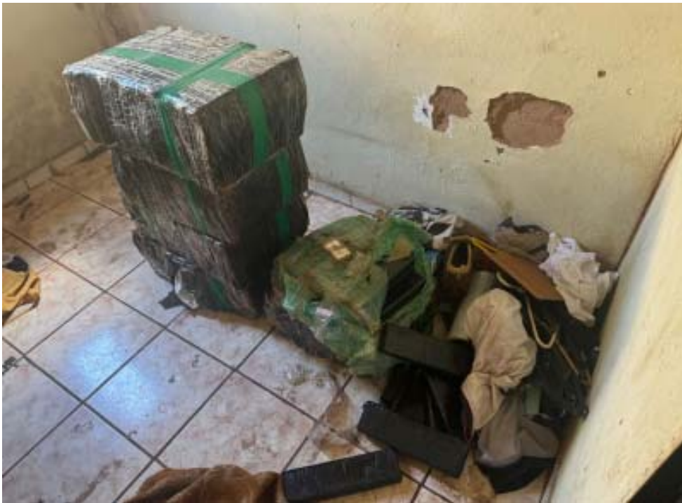
Em uma única operação, agentes apreenderam cerca de 200 quilos de maconha, causando prejuízo de R$ 300 mil ao tráfico

A Polícia Civil apreendeu, no dia 24 de maio, 26 tijolos de maconha. A droga estava escondida em um imóvel localizado no Parque Industrial Tanquinho, zona Norte de Ribeirão Preto.