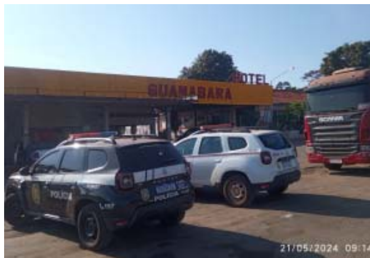
Policiais civis do SIG de Jaboticabal localizaram máquinas de jogo de azar em estabelecimento à beira de rodovia da cidade

As estruturas das máquinas foram apreendidas e levadas para a sede do SIG de Jaboticabal. A ocorrência foi registrada com a natureza Jogo de Azar. As investigações prosseguem e os responsáveis vão responder pela prática de jogo proibido.