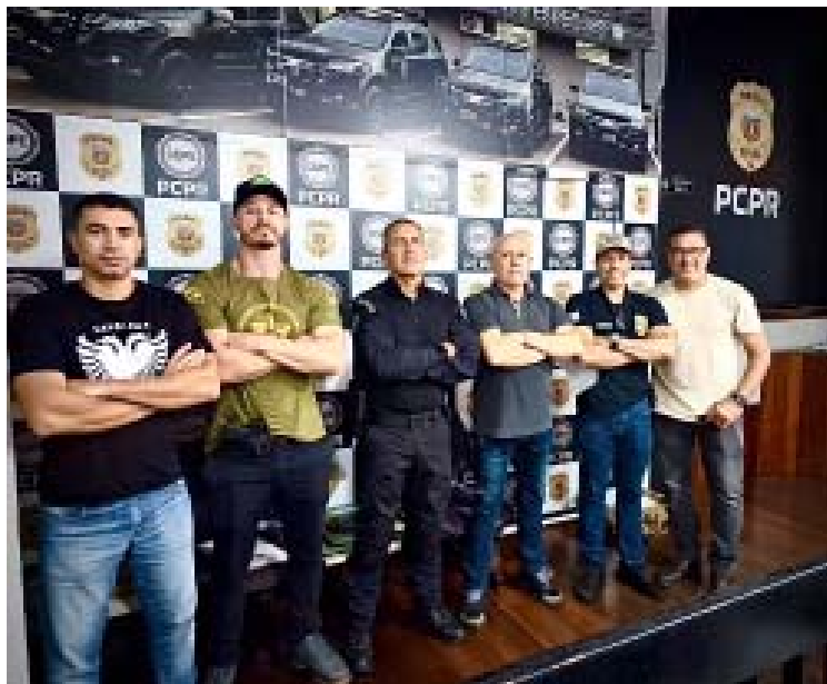
Policiais civis de São Joaquim da Barra (SP) e Curitiba (PR), que atuaram na prisão de empresário envolvido em roubo na cidade de Morro Agudo (SP)

Suspeito é apontado como líder de quadrilha que efetuou o roubo de três tratores e um caminhão em Morro Agudo