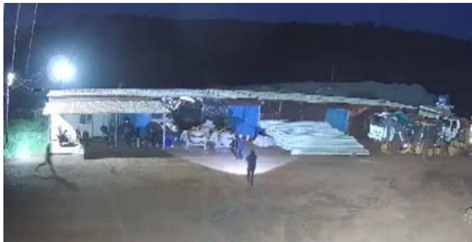
Quadrilha que roubou canteiro de obras foi identificada e integrantes foram presos (foto acima); em outra ação, denúncia por WhatsApp da DEIC levou à recuperação de caminhão roubado

Depois de periciado, o veículo foi entregue à proprietária, que é da cidade de Bauru. Ainda não há suspeitos pelo roubo da carga. As investigações prosseguem.