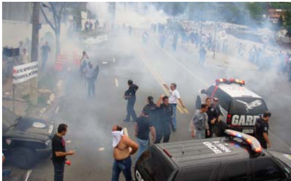
Não é a primeira vez que governo coloca as duas forças em lados diferentes: um dos maiores confrontos entre policiais civis e militares ocorreu nos arredores do Palácio dos Bandeirantes, em 2008

- O PM não tem preparo para o trabalho de Polícia Judiciária. Investigação, elaboração de inquérito, coletar provas e evidências, fundamentais para condenar