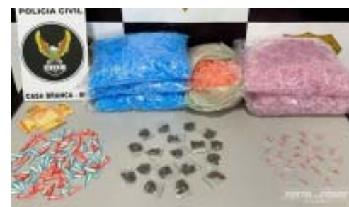
Homem foi preso em Tambaú por tráfico de drogas