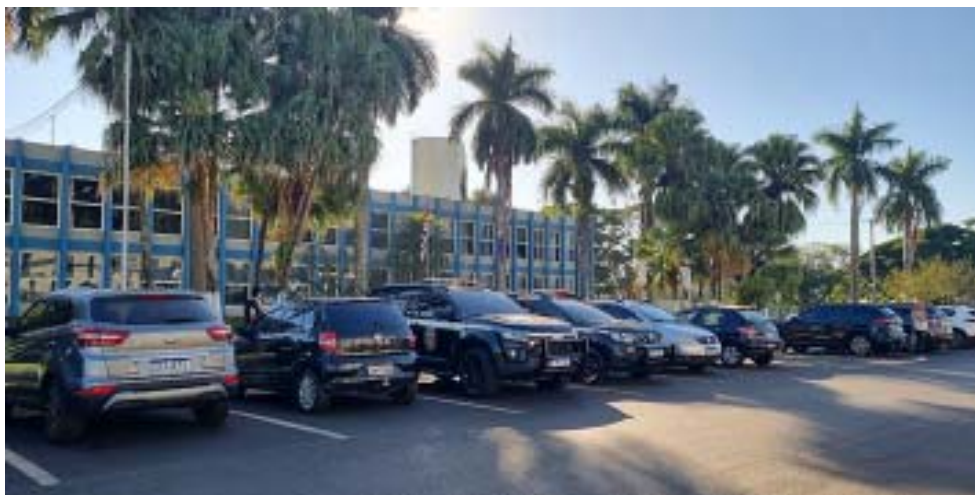
Prefeitura de Serrana foi um dos alvos da operação

A Delegacia Seccional de Ribeirão Preto informou que foram apreendidos documentos e equipamentos eletrônicos. O material vai passar por perícia e as investigações prosseguem. A Prefeitura de Serrana e a empresa Giovanivans foram procuradas mas não se manifestaram.