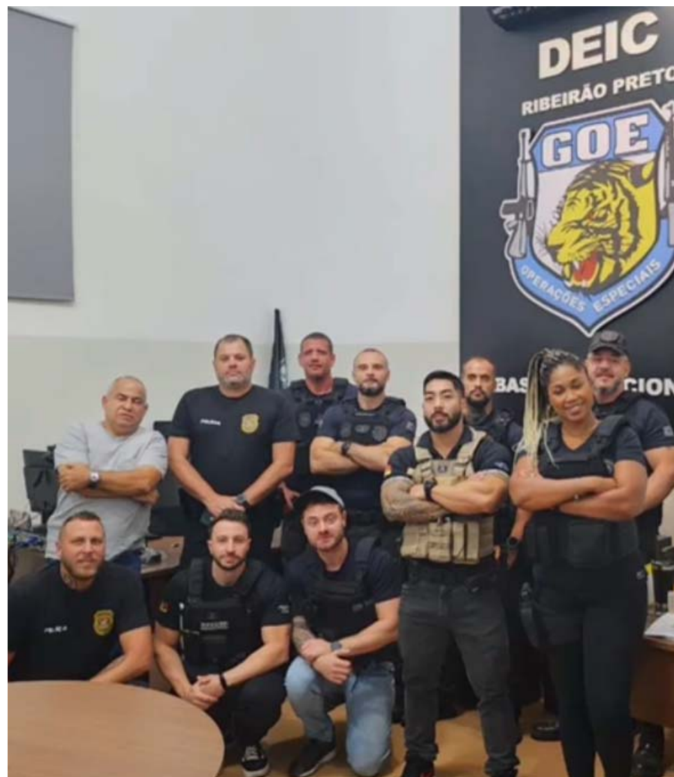
Parte dos policiais civis da DEIC que participaram da ação

encaminhados à Polícia Civil do Rio Grande do Sul, que prosseguirá com as investigações, até a conclusão do inquérito que pretende desmantelar por completo a organização criminosa.