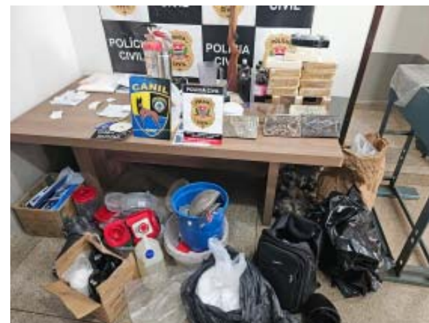
Drogas e produtos usados no laboratório foram apreendidos e casal foi preso

O casal foi levado para a delegacia de Batatais, onde foi feito o flagrante. Em seguida, foram encaminhados para unidades prisionais, permanecendo à disposição da Justiça.