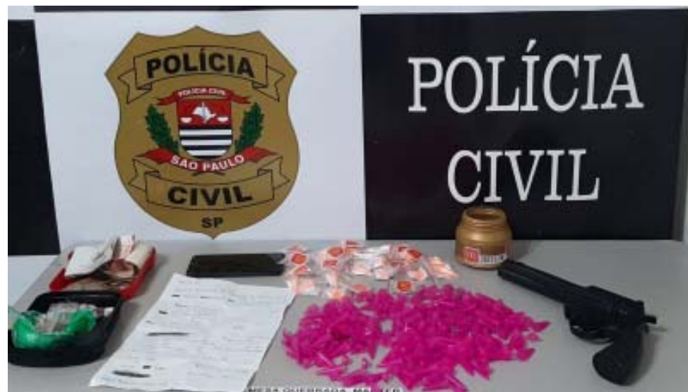
Policiais civis de Leme desmantelaram grupo criminoso que monitorava ações policiais na região e apreenderam grande quantidade de drogas

Os trabalhos policiais foram realizados por integrantes do Departamento de Polícia Judiciária de São Paulo Interior 9 (Deinter-9), por meio da Delegacia de Investigações Gerais de São João da Boa Vista, com o apoio da Polícia Civil e da Polícia Militar de Minas Gerais e da Polícia Militar de São Paulo. Durante a diligência, cumpriram um mandado de busca e apreensão e de prisão. Na