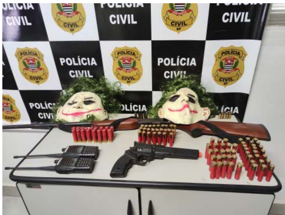
Armas e munições de grosso calibre, radiocomunicadores e máscaras foram apreendidos com quadrilha

São Paulo Interior 9 (Deinter 9), por meio da Delegacia de Polícia de Leme, com o apoio da Delegacia Seccional de Limeira e das Delegacias de Araras, Pirassununga, Cordeirópolis e Santa Cruz da Conceição. Durante as diligências, foram cumpridos 14 mandados de busca e apreensão e foram apreendidos 52 porções de cocaína, 12 porções de maconha, 134 eppendorfs vazios, R$ 2.163 em espécie, 17 celulares, um simulacro de arma de fogo, um notebook, dois pen drives, um rádio transmissor, uma máquina de cartões. Foram apreendidos também itens, que são produtos de furto e receptação, subtraídos de supermercados da cidade. Três pessoas foram presas em flagrante. Os detidos foram conduzidos à Delegacia, onde passaram pelos trâmites de polícia judiciária. Após, foram encaminhados ao cárcere e ficarão à disposição do Poder Judiciário.