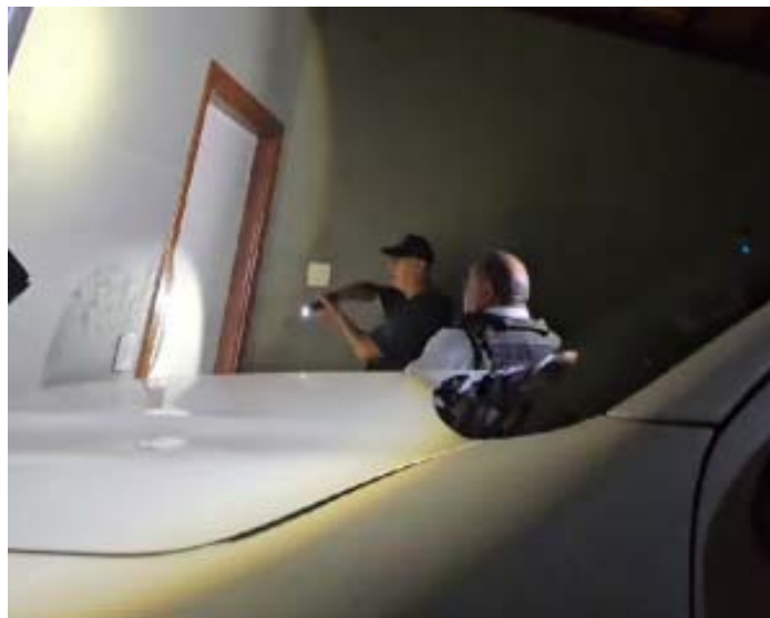
Ao lado, policiais civis de Barretos em ação durante operação contra desvio de cargas; abaixo equipe que atuou na apreensão de 300 mil maços de cigarros paraguaios

Em razão disso, os homens foram presos em flagrante pelo crime de contrabando. Eles serão apresentados na Justiça Federal para audiência de custódia. O caminhão também foi apreendido.