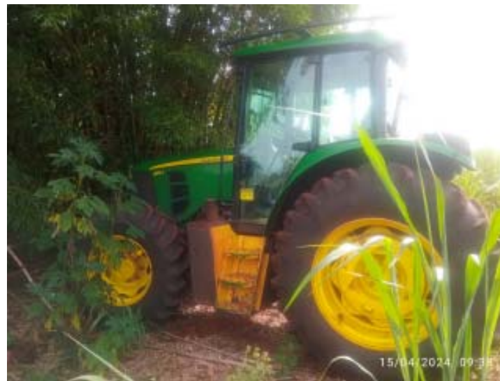
Máquinas agrícolas avaliadas em mais de R$ 1 mi estavam escondidas em assentamento de trabalhadores sem-terra

A Polícia Civil do Estado de São Paulo através do SIG (Setor de Investigações Gerais) de Jaboticabal, prende um homem envolvido pelo crime de tráfico de drogas e posse irregular de munições de arma de fogo no Jardim Das Rosas. Os agentes cumpriram mandado de busca domiciliar no imóvel do investigado que se trata de uma edícula, onde o mesmo foi localizado. Alvo de investigações, o indiciado foi preso, permanecendo à disposição da Justiça.