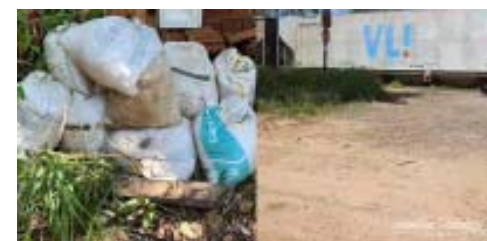
Sacas com açúcar furtado de trem estavam no quintal do detido