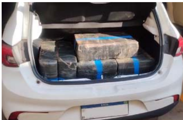
Acima, policiais civis organizam mais de meia tonelada de drogas apreendidas no Heitor Rigon; ao lado, carro foi flagrado pela especializada transportando 140 quilos de maconha