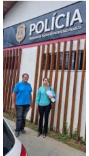
Acima, a partir da esquerda, Itirapuã, Guará e Patrocínio Paulista; abaixo a partir da esquerda, São José da Bela Vista e Batatais, encerrando a área da Seccional de Franca