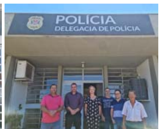
Fátima iniciou as visitas às delegacias da área da Seccional de Ribeirão Preto em 06 de novembro: acima, a partir da esquerda, Cássia dos Coqueiros e Altinópolis; abaixo, a partir da esquerda, Santo Antônio da Alegria e Cajuru