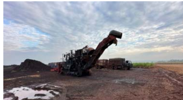
Máquinas foram destruídas após incêndio criminoso

ambientais às margens do Rio Pardo, fato este a ser apurado pelas autoridades. A empresa lamenta profundamente o ocorrido e reitera que as medidas em tais áreas são fruto do cumprimento de Ação Civil Pública".