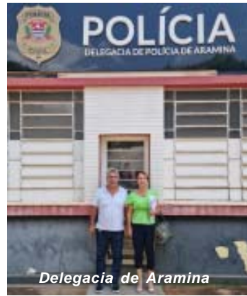
Delegacia de Aramina