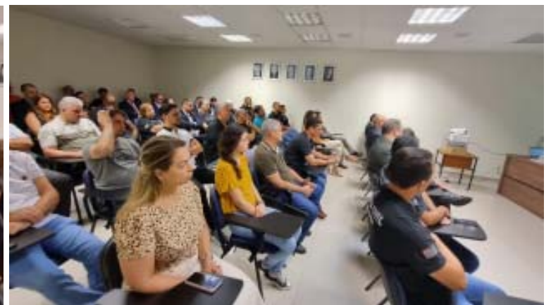
Policiais civis da área de atuação da Delegacia Seccional de Polícia Civil de Ribeirão Preto prestigiaram a palestra