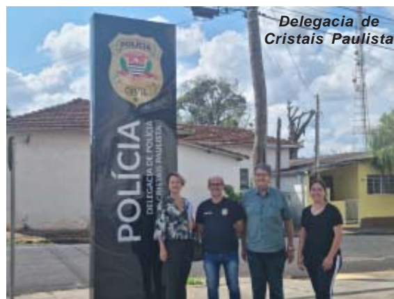
Delegacia de Cristais Paulista