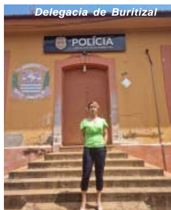
Delegacia de Buritizal