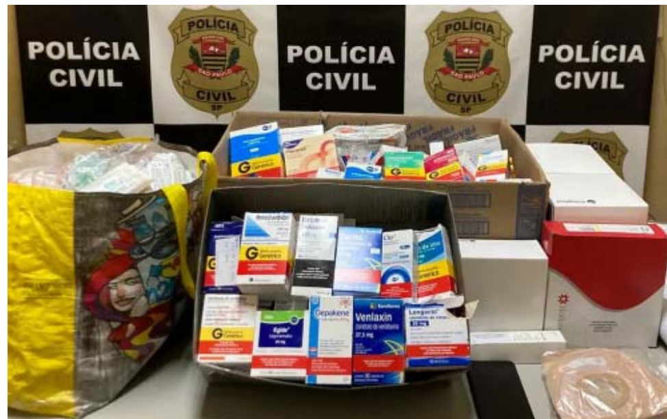
Ao cumprir mandado de busca e apreensão, policiais civis encontraram muitos remédios de uso controlado na casa de conselheira

Na sequência, os policiais civis foram até o Residencial Aragão, uma área onde haveria tráfico. A investigada era uma mulher. Ao chegarem para cumprir o mandado de busca, os policiais encontraram a TV ligada e documentos sobre a mesa, indicando que ela havia fugido pouco antes, ao perceber a chegada da equipe. Foram apreendidas diversas porções de drogas. A mulher, já identificada, será indiciada e passa a ser procurada.