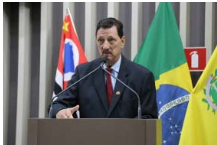
O delegado agradeceu, emocionado, à comenda entregue pelos vereadores