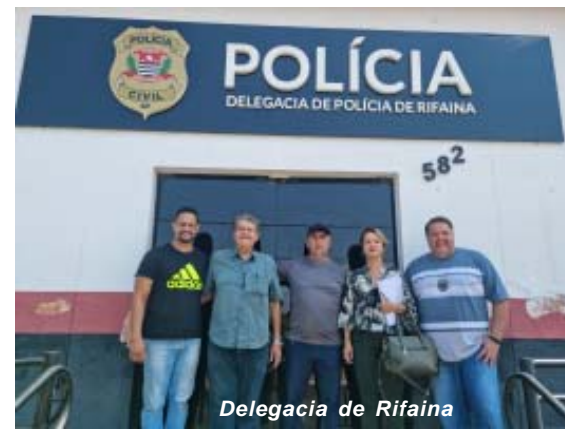
Delegacia de Rifaina