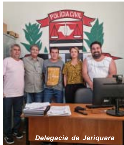
Delegacia de Juruá