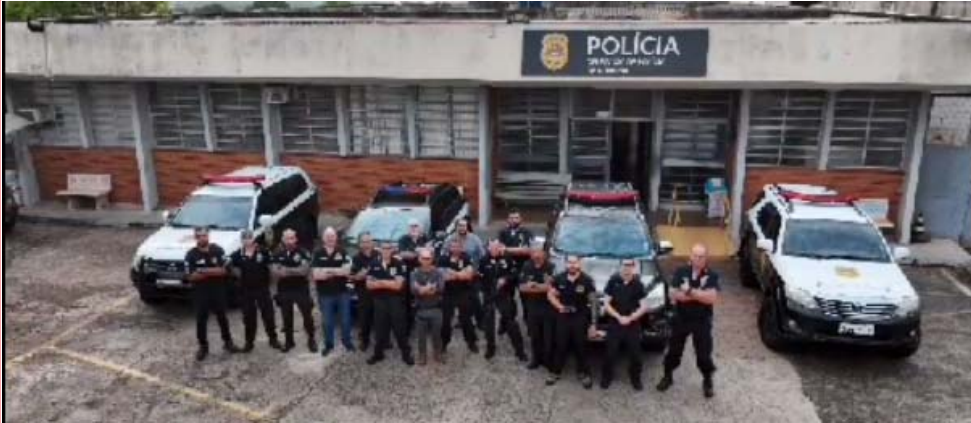
Policiais civis de toda a região que participaram da operação de recaptura de suspeitos liberados após audiência de custódia

Dupla teria assaltado loja em Guariba agindo com violência e ameaçando as funcionárias do estabelecimento com o uso de armas de fogo