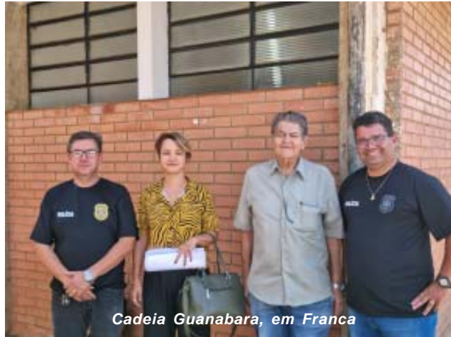
Cadeia Guanabara, em Franca