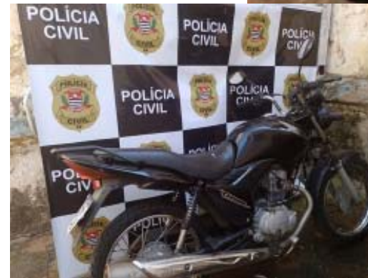
Nos dois casos, motocicletas utilizadas por assaltantes acabaram apreendidas; objetos roubados das vítimas também foram recuperados