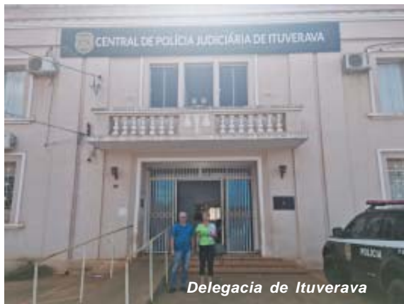
Delegacia de Ituverava