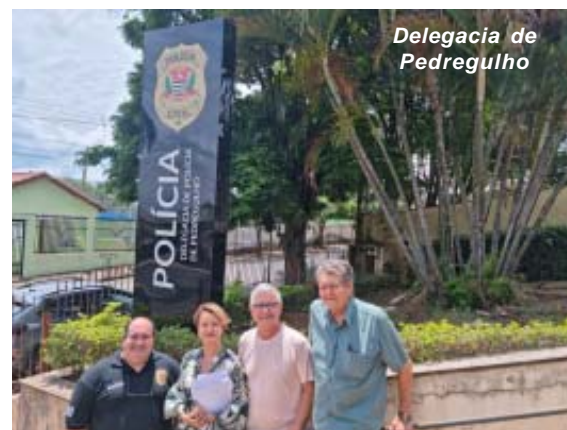
Delegacia de Pedregulho