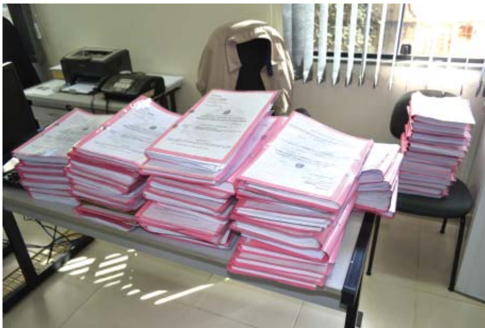
Para o Sinpol, com a falta de recursos humanos, é impossível investigar e solucionar todos os inquéritos policiais

números obtidos por uma pesquisa realizada pela Associação dos Delegados de Polícia do Brasil (Adepol do Brasil), onde São Paulo está na última colocação entre todos os estados brasileiros em relação à resolução de inquéritos.