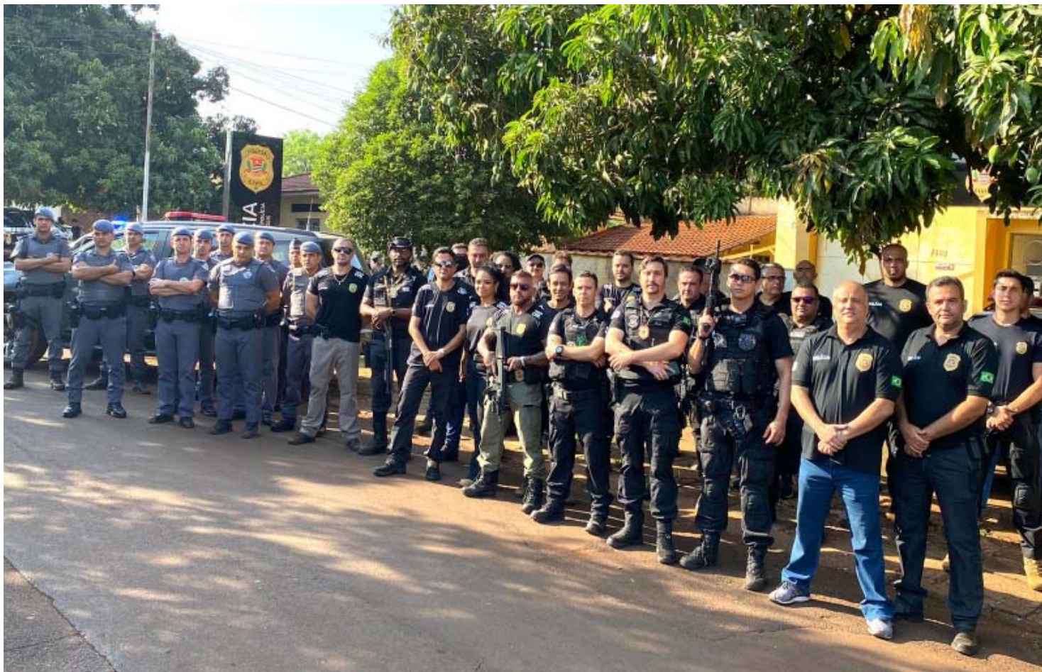
Policiais civis e militares de Miguelópolis e região, com policiais de Minas Gerais, deflagraram operação “Piratas do Rio”, contra grupo que aterrorizava rancheiros e fazendeiros às margens do Rio Grande