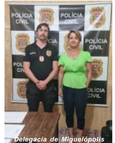
Delegacia de Miguelópolis