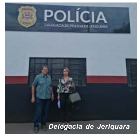
Delegacia de Juruá