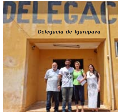
Delegacia de Igarapava