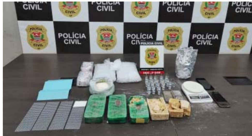
Drogas apreendidas em apartamento na Vila Virgínia, onde morador guardava a "mercadoria"

pamentos roubados foram recuperados. Os dois foram presos em flagrante por roubo e tráfico de drogas, permanecendo à disposição da Justiça.