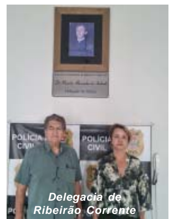
Delegacia de Ribeirão Corrente