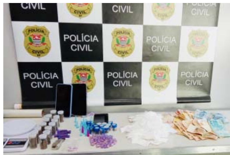
Policiais civis da especializada apreenderam muita droga e dinheiro do tráfico

Os presos por conta das duas ocorrências foram levados para a sede da DISE de São Carlos. Eles foram autuados e presos em flagrante. Depois seguiram para o Centro de Triagem de São Carlos, permanecendo à disposição da Justiça.