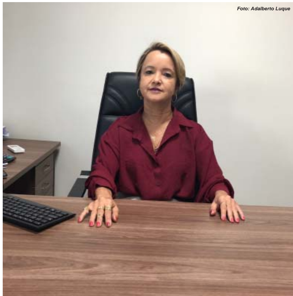
Presidente pretende percorrer toda a região para agradecer e ouvir os policiais civis