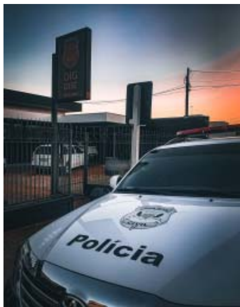
Mais um chefe do crime organizado acabou atrás das grades

Homem seria o responsável por coordenar roubos de caminhonetes na região de São Carlos