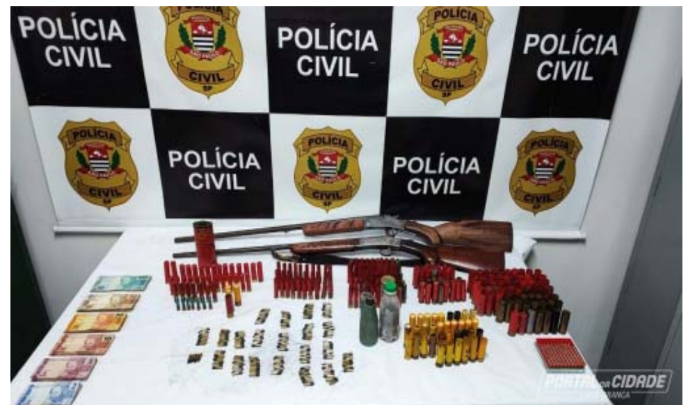
Durante Operação Campo Seguro, policiais civis de Tambaú apreenderam armas e muitas munições

Por: Portal da Cidade de Casa Branca, com adaptações