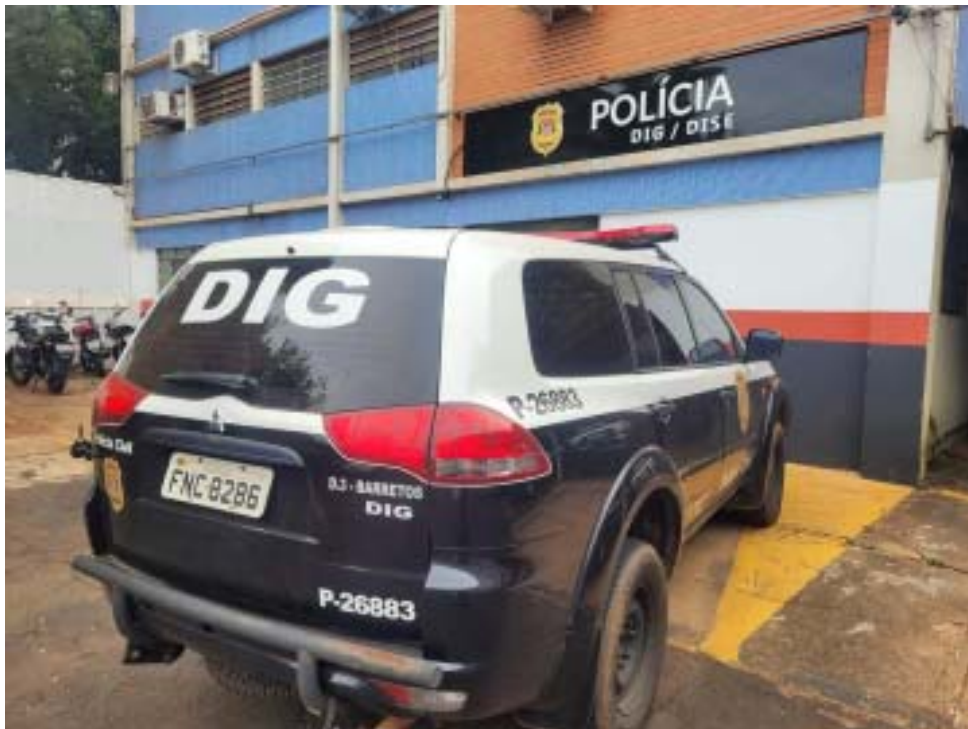
Policiais civis de Barretos localizaram e prenderam acusado de tráfico

Os mandados foram todos cumpridos na cidade de Ituverava, onde os suspeitos estariam. Desta forma, foi necessário organizar uma força-tarefa com policiais civis das duas cidades para garantir o sucesso da ação. Os autores teriam sido identificados pelos policiais civis após uma rigorosa investigação, que resultou na representação pelos mandados de busca e apreensão e de prisão, deferidos pela Justiça. Durante as buscas, os poli-