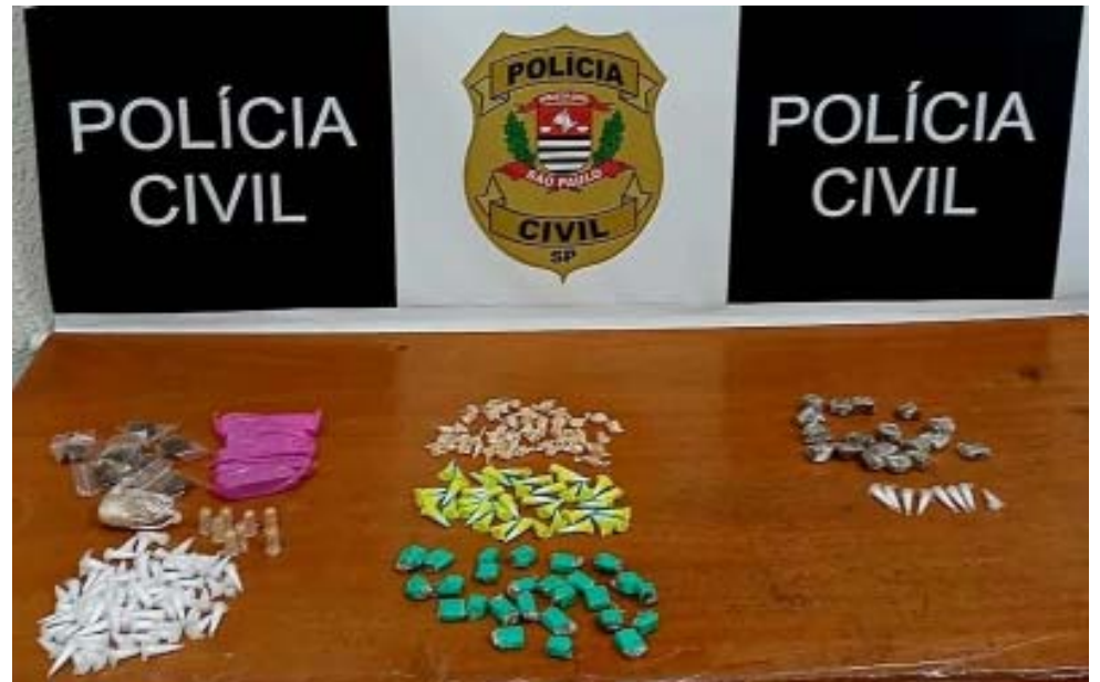
Policiais civis de Ibaté apreenderam drogas com suspeito de tráfico

ciais civis localizaram e apreenderam uma motocicleta com sinais de adulteração. O condutor recebeu voz de prisão em flagrante. As investigações prosseguem para avaliar se o trio teria cometido outros roubos na região.