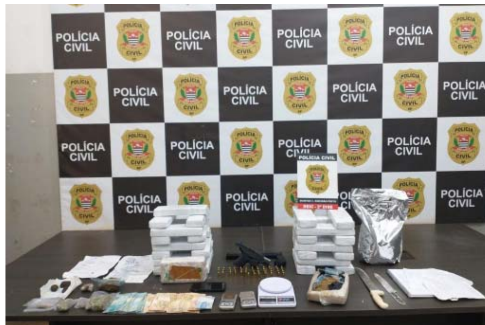
Acima, droga apreendida na vidraçaria de fachada; ao lado, cocaína com extremo grau de pureza, que era comercializada por traficante que frequentava festas de alta classe social

eles transportavam a droga em carteiras com compartimentos, para não chamar a atenção, caso fossem abordados. Os dois foram levados para a sede da DISE/DEIC, onde receberam voz de prisão em flagrante. Depois seguiram para uma unidade prisional, onde permaneceram à disposição da Justiça.