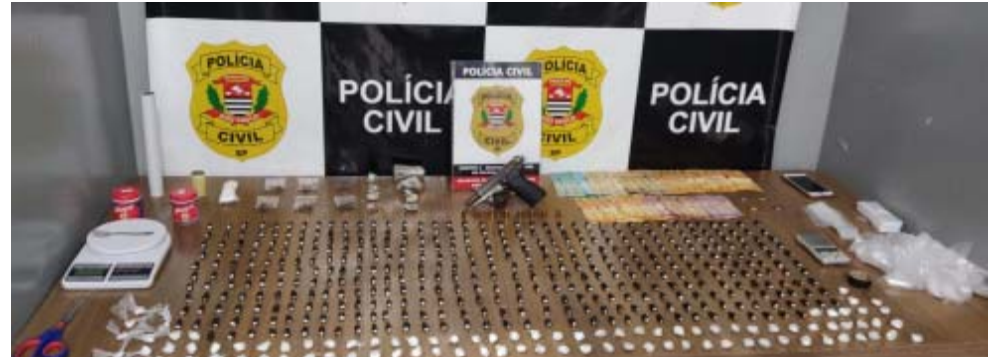
Policiais civis da especializada de Franca encontraram grande quantidade de drogas com irmãos (foto acima) e, em outra ação, apreenderam drogas e localizaram local onde traficantes falsificavam agrotóxicos

Eles foram levados para a sede da especializada, onde foram indiciados. Depois seguiram para uma unidade prisional, onde vão aguardar à disposição da Justiça.