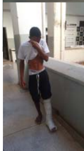
Gangue surpreendia vítimas, que estavam distraídas na rua; chefe da quadrilha, de 19 anos, acabou preso e demais integrantes apreendidos pela equipe da DIG/DEIC