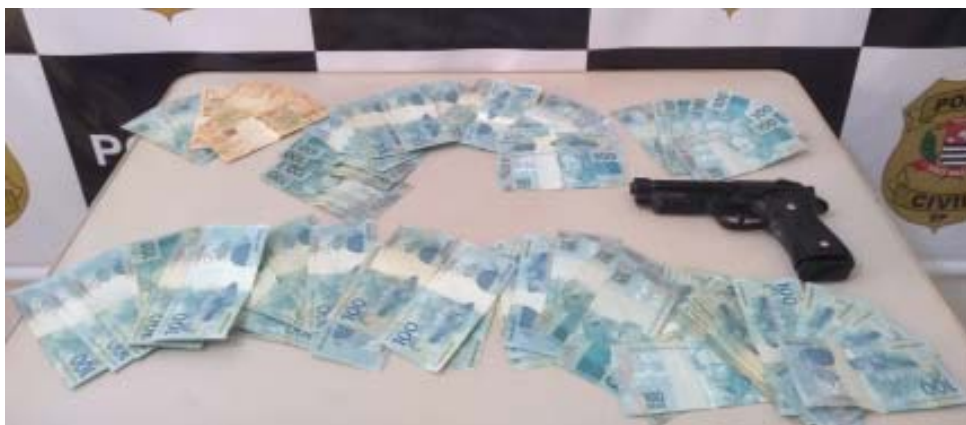
Policiais civis encontraram R$ 8 mil com os suspeitos

Os três presos na operação foram encaminhados para a cadeia pública de Santa Rosa de Viterbo, onde permanecem à disposição da Justiça. As investigações prosseguem para localizar os outros envolvidos.