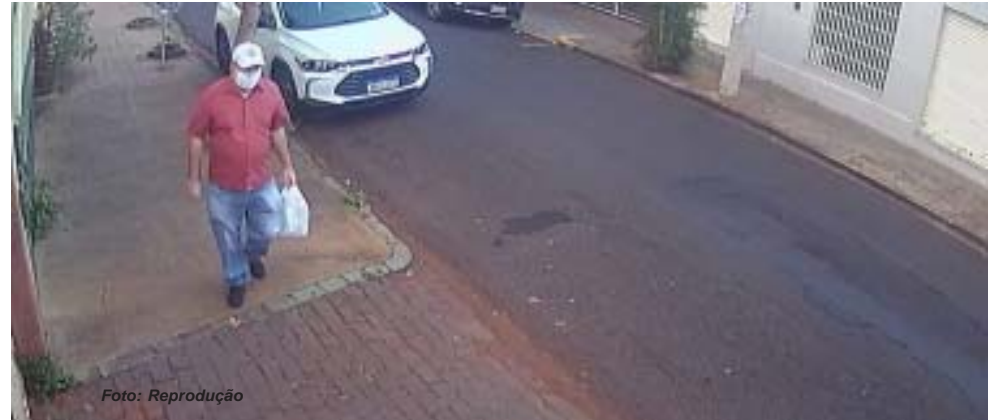
Homem foi filmado em câmera de segurança e DDM conseguiu reconstituir seu trajeto e efetuar a prisão do já condenado por estupro no nordeste brasileiro

Ele foi ouvido e depois encaminhado para uma unidade prisional, pois havia um mandado de prisão contra ele. A reportagem não conseguiu localizar a defesa do suspeito. Um simulacro de arma de fogo foi encontrado na casa do capturado, que deve permanecer preso e à disposição da Justiça. Agora a Polícia Civil tenta descobrir se ele teria cometido outros estupros em Ribeirão Preto.