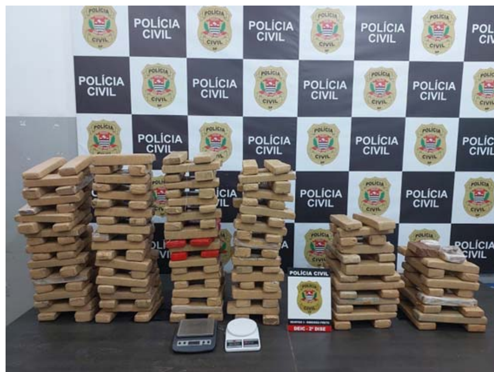
Primeira grande apreensão efetuada pela equipe da DISE/DEIC de Ribeirão Preto em janeiro de 2023

Assessoria de Imprensa e Comunicação da Secretaria da Segurança Pública