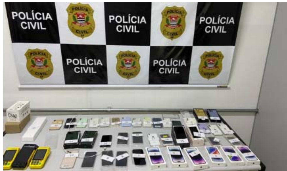
Comerciante não soube comprovar origem dos celulares

As apreensões ocorreram para que as investigações sobre a origem dos celulares prosseguissem. A principal suspeita é crime de descaminho. Foi instaurado um inquérito e a Polícia Civil vai apurar o fato.