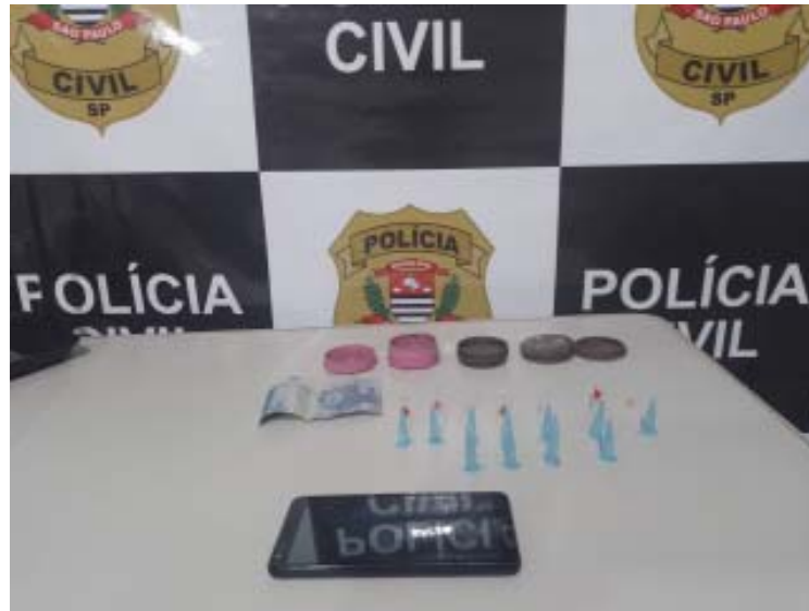
Sete pessoas acabaram presas nas operações realizadas pela Polícia Civil em Cravinhos e provas de crime foram apreendidas

Perséfone, uma divindade da mitologia grega, sendo conhecida como a deusa da agricultura e da vegetação. Compartilhava esses atributos com sua mãe, Deméter, sendo cultuadas juntas nos Mistérios de Elêusis. Foi raptada por Hades, quando ele a viu colhendo flores, e levada para o submundo.