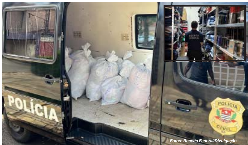
Polícia civil cuidou da análise de roupas de grife que, possivelmente, são produtos falsificados; no detalhe, técnico da Receita constatou irregularidades

Como havia produtos com indícios de falsificação, os fiscais da Receita Federal acionaram a Polícia Civil, através da Central de Polícia Judiciária Integrada, que foi até a loja. Os produtos com indícios de falsificação foram apreendidos pelos policiais civis. Eles foram encaminhados para serem periciados e poder confirmar se são ou não originais. Nos dois casos, o proprietário da loja pode responder criminalmente em caso de irregularidade.