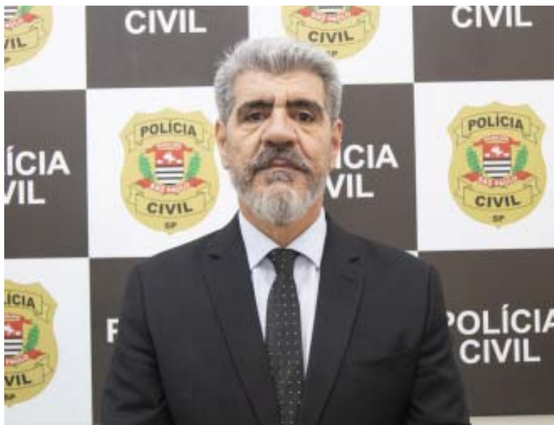
O delegado responsável pela DEIC destacou o êxito das operações conjuntas

Divisão especial realizou incursões contra pessoas ligadas a crimes praticados nos estados de Alagoas e Santa Catarina