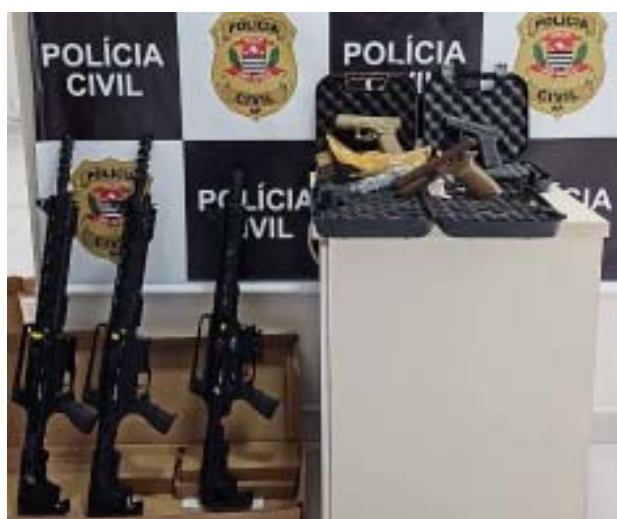
Armas apreendidas na casa de um dos donos de empresa acusada de lesar investidores

Armas foram localizadas durante cumprimento de mandado de busca e apreensão em imóveis de empresário acusado de golpe financeiro