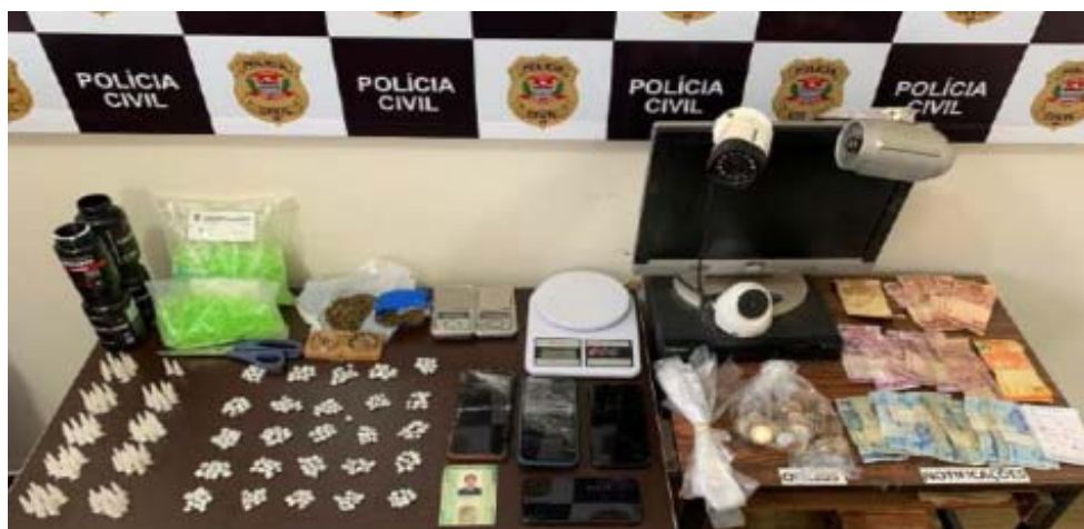
Drogas apreendidas em Orlandia

Todo o material apreendido foi levado para a sede Delegacia de Orlandia, junto com os homens flagrados no local. Os dois foram autuados em flagrante e encaminhados para o sistema prisional, permanecendo à disposição da Justiça.