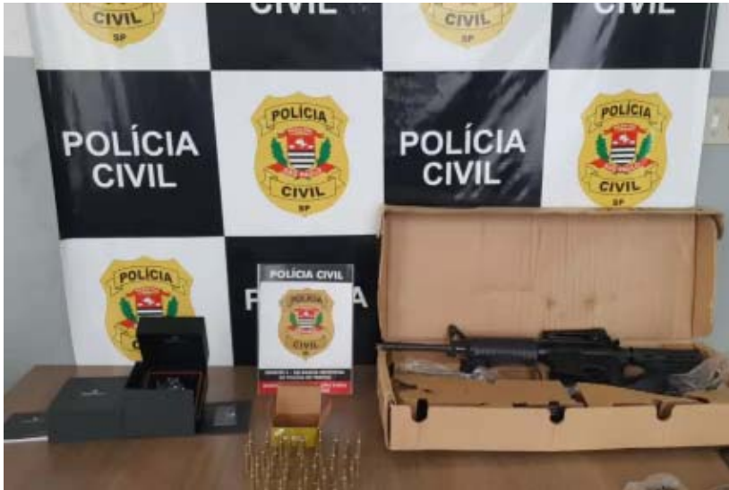
Entre os itens apreendidos, um fuzil com numeração suprimida

Mais de 30 policiais civis saíram às ruas de Franca e Cristais Paulista para cumprimento de mandados de busca e apreensão que resultaram em seis prisões em flagrante