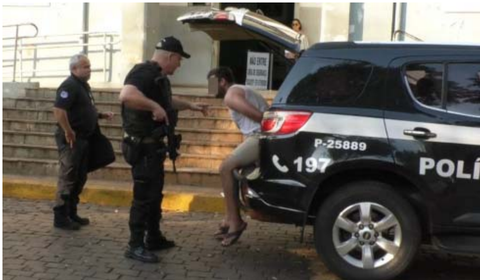
Suspeitos foram presos por policiais civis da DEIC, em conjunto com policiais civis de Santa Catarina

Policiais civis de Santa Catarina investigavam desvio de carga avaliada em R$ 700 mil e envolvidos são de Ribeirão Preto; DEIC Ribeirão Preto participou das ações