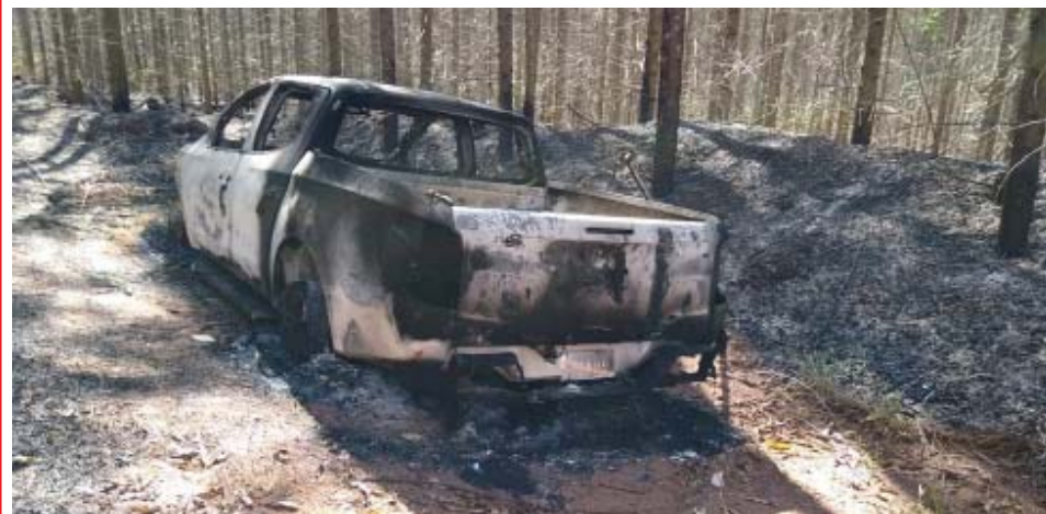
Carro do empresário sequestrado foi abandonado e queimado pelos sequestradores

Músico e empresário tinha sido sequestrado por grupo que exigiu R$ 2 milhões para libertá-lo, mas investigações fizeram com que o homem fosse solto sem que houvesse pagamento