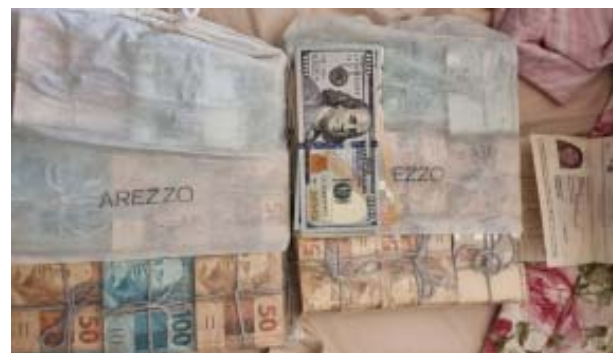
Durante operação realizada em condomínios de luxo de Ribeirão Preto (foto acima) e Sertãozinho, policiais civis apreenderam dinheiro (ao lado), carros de luxo, relógios e outros objetos