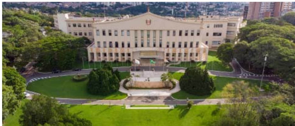
O novo inquilino do Palácio dos Bandeirantes, sede do governo paulista, terá que cuidar da falta de 16 mil policiais civis

Ele lembra que uma resolução da DGP (Delegacia Geral de Polícia) de 2013 estabeleceu em 41 mil o número necessário de policiais civis