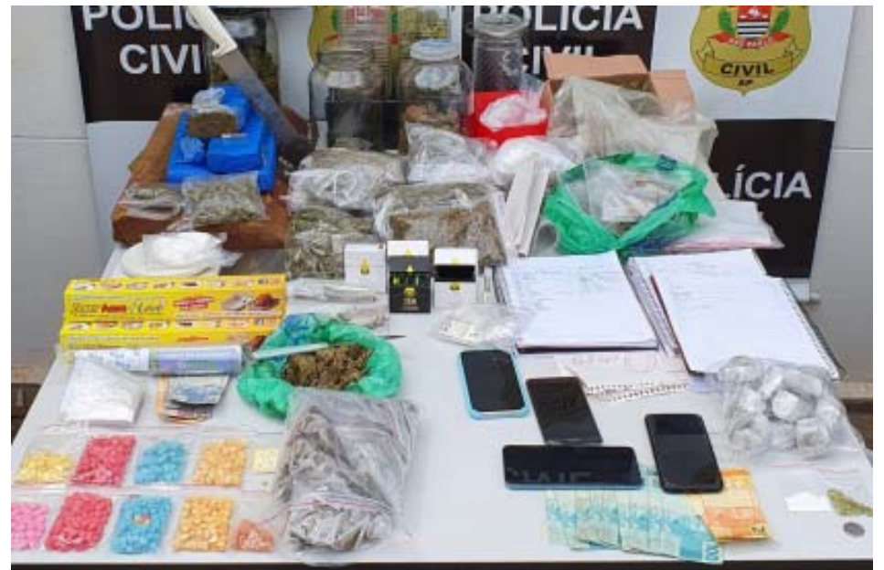
DISE Araraquara realizou grande apreensão

Já o adolescente vai responder a ato infracional por tráfico de drogas. Ele foi conduzido para a Fundação Casa, em Araraquara, onde será submetido a medidas socioeducativas.