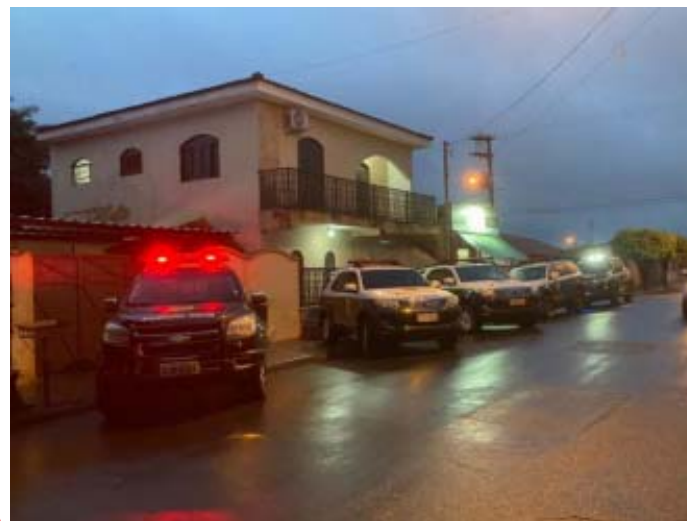
Em novo desdobramento da Operação Zona Livre, policiais civis de Guariba prendem mais um suspeito de integrar quadrilha

A última fase da operação tinha sido realizada no dia 10 de agosto. Esta foi a quinta fase. No cumprimento do mandado de prisão, o homem foi localizado e levado para a Delegacia de Polícia, seguindo depois para a cadeia pública de Pradópolis, onde permanece à disposição da Justiça. Todos estão respondendo por associação criminosa, receptação, adulteração de sinal identificador de veículo automotor e roubo qualificado.