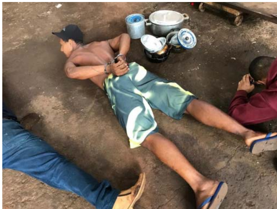
Acima, policiais da especializada prendem suspeito de roubos de armas e bicicletas; ao lado, equipe da DIG/DEIC prende estelionatários que utilizavam documentos falsificados em agência bancária

a sede da especializada, no Centro de Ribeirão Preto, onde acabaram autuado em flagrante. Todos foram encaminhados a uma unidade prisional e seguem à disposição da Justiça.