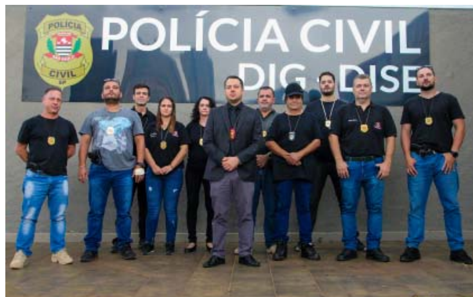
Equipe da DIG de São Carlos

Ele passou por avaliação e não tinha ferimentos. O padrasto não foi encontrado no local do cativo. Havia apenas um casal que estava com a criança. Os dois foram conduzidos para a CPJ de São Carlos, onde prestaram depoimento. O padrasto segue sendo procurado. A criança foi entregue sob os cuidados da mãe, que ficou muito emocionada com a rápida solução do caso.