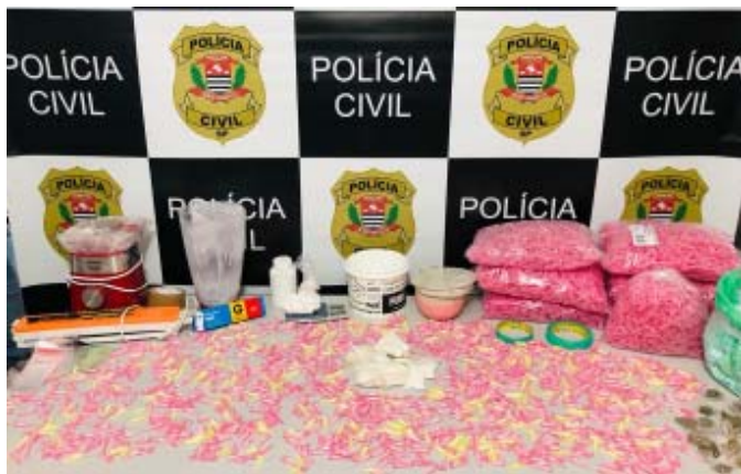
Centenas de porções de drogas foram apreendidas por policiais civis que integram a DISE São Carlos

Entorpecentes foram localizados em apartamento utilizado para fracionar e refinar cocaína