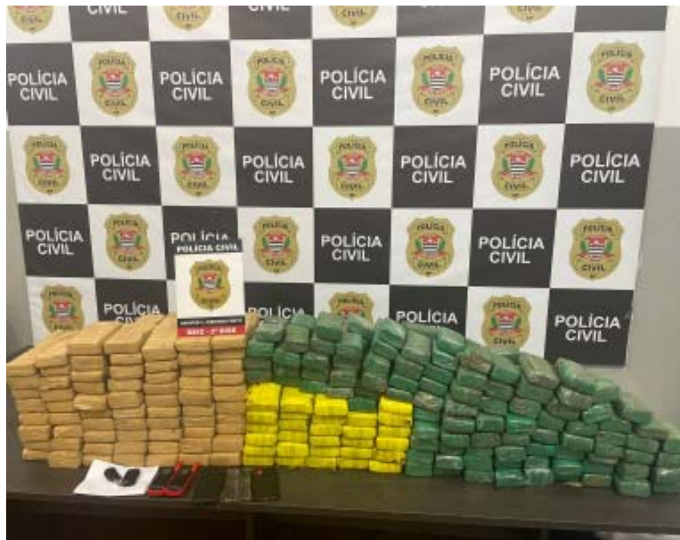
Acima, 200 quilos de maconha; abaixo drogas avaliadas em R$ 200 mil

amigo e negou saber que o carro era produto de furto. O veículo foi apreendido e o rapaz levado para a sede da DISE/DEIC. O delegado estabeleceu fiança de R$ 2,5 mil, que foi paga pelo indiciado. Ele vai responder em liberdade pelo crime de receptação.