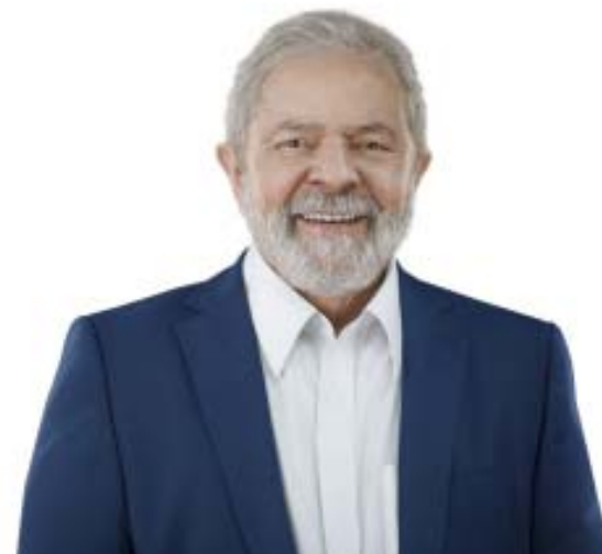
Lula volta à presidência da República

Em 1986 foi eleito deputado federal por São Paulo, recebendo votação recorde à época. Em 1989 concorreu à presidência da República pela