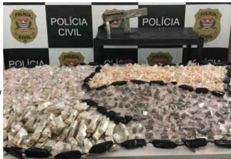
Policiais civis de São Carlos localizaram milhares de porções de drogas e submetralhadora artesanal com casal

Depois de ouvidos, eles foram presos em flagrante e encaminhados ao Centro de Triage de São Carlos, onde devem permanecer à disposição da Justiça. As investigações prosseguem para identificar outros envolvidos na venda das porções pelo bairro Santa Angelina e região.