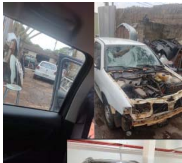
Ao lado, veículo conduzido pelo motorista acusado de atropelar e matar homem na Avenida Recife; abaixo o veículo que atropelou e causou a morte do empresário Tony Leme, ambos em Ribeirão Preto

Um homem, de 29 anos, foi atropelado quando atravessava a Avenida Recife, no Jardim Aeroporto, zona Norte da cidade. O motorista que atropelou fugiu, segundo testemunhas, em alta velocidade e sem prestar socorro. O homem morreu antes mesmo de receber atendimento médico.