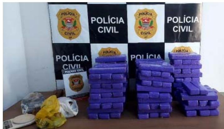
Policiais civis de Batatais localizaram 344 tijolos de maconha com homem que acabou preso em flagrante

Policiais civis da Delegacia de Batatais realizaram, no dia 09 de setembro, uma importante ação contra o tráfico de drogas naquela cidade. Os policiais civis realizavam um intenso trabalho de investigação e conseguiram identificar um grande traficante de maconha que agia na cidade.