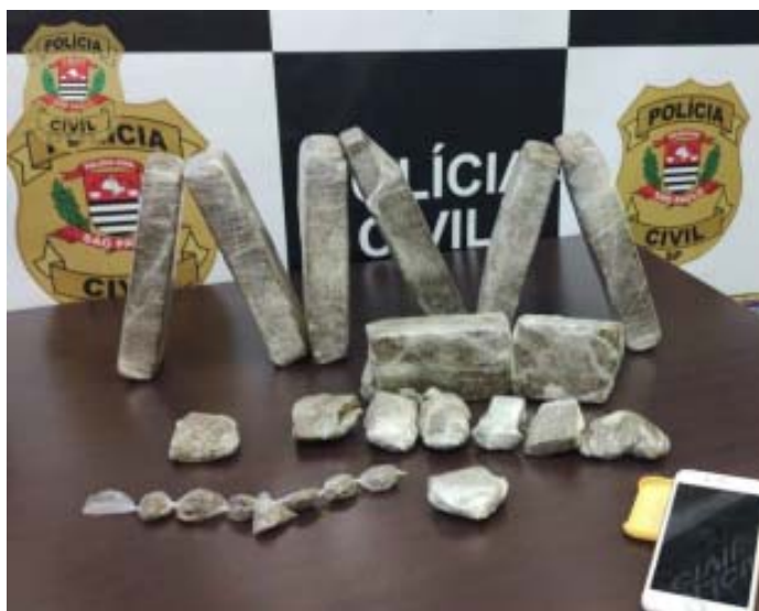
Droga apreendida pelos policiais civis de Serrana

Durante a ação, foram apreendidas porções