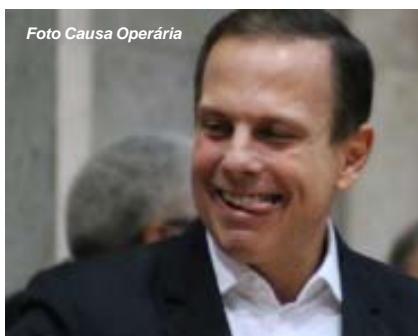
Acima, Doria, que foi considerado por muitos policiais civis o pior governador do PSDB; ao lado, Alckmin, sendo cobrado pelo presidente do Sinpol, Célio Antônio Santiago: recebia os policiais civis, mas não atendia às reivindicações da categoria

Em 01 de janeiro de 2019, João Doria Júnior assume o governo do Estado. Durante a campanha, em 2018, prometeu salários melhores aos policiais civis. Não cumpriu. Deu um reajuste de 5% para policiais civis da ativa e aposentados. No início de 2022, pouco antes de deixar o governo para iniciar a campanha como pré-candidato a presidência da República, Doria anun-