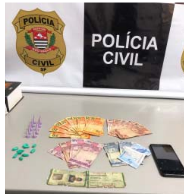
Apreensão feita por policiais civis de Luiz Antônio

de crack, maconha e cocaína, além de cinco celulares, quatro rolos de plástico filme para embalar a droga, uma balança de precisão e R$ 266 em cédulas. Os dois homens detidos foram encaminhados para a cadeia pública de Santa Rosa de Viterbo e permanecem à disposição da Justiça.