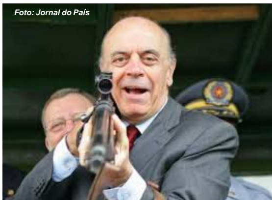
Ao lado, José Serra, que ordenou ação da PM resultante na Batalha dos Bandeirantes, durante greve dos policiais civis em outubro de 2008

Irritado, o político exigiu punição aos envolvidos e alguns policiais civis buscaram identificar os manifestantes, chegando a número