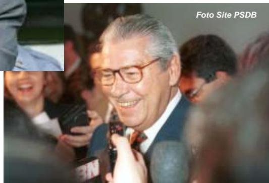
Mário Covas (à direita) inaugurou o ciclo de governadores eleitos pelo PSDB, considerados algozes pelos policiais civis

de 51, todos punidos com transferência para os mais distantes rincões do Estado. Inclusive casais onde ambos eram policiais civis, tiveram suas transferências cada qual para um lugar distante do outro.