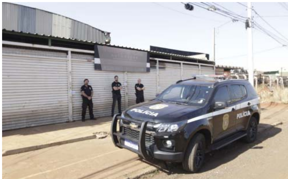
Mais da metade dos desmanches de Ribeirão Preto estão irregulares e vários foram lacrados durante operação

Ele revelou, inclusive, que mais da metade dos 90 desmanches existentes na cidade não estão regulamentados para funcionar. Vários estabelecimentos foram lacrados e muito material foi apreendido. Esse material vai passar por perícia para tentar confirmar sua procedência.