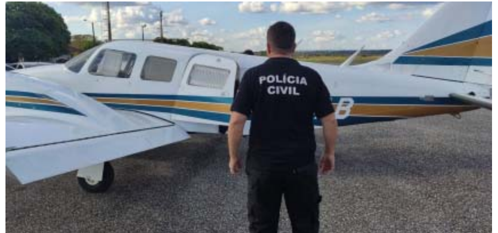
Ação de policiais civis do SIG de Jaboticabal resultou em prisões, apreensões e prejuízo milionário ao crime organizado