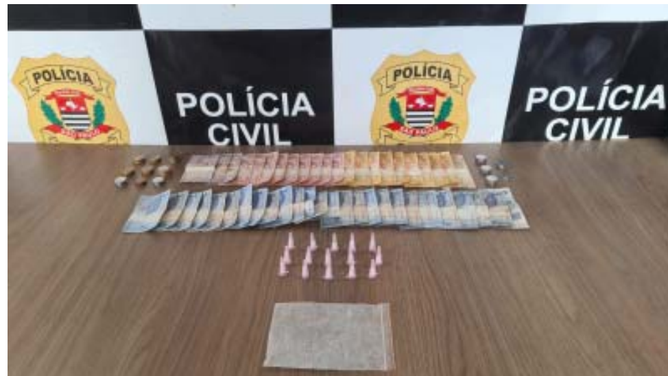
Acima, droga apreendida durante prisão de suspeito no Jardim Santa Cruz; ao lado, droga encontrada com homem de 54 anos na Vila São Sebastião

Ao realizar buscas, os policiais civis encontraram maconha e cocaína, além de dinheiro e material para embalar a droga. O homem, que já tinha diversas passagens por tráfico, foi autuado em flagrante e encaminhado ao sistema prisional.