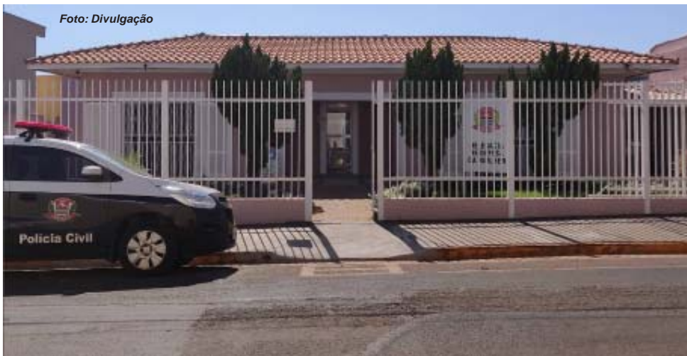
DDM de Barretos desmantelou quadrilha que explorava prostituição infantil