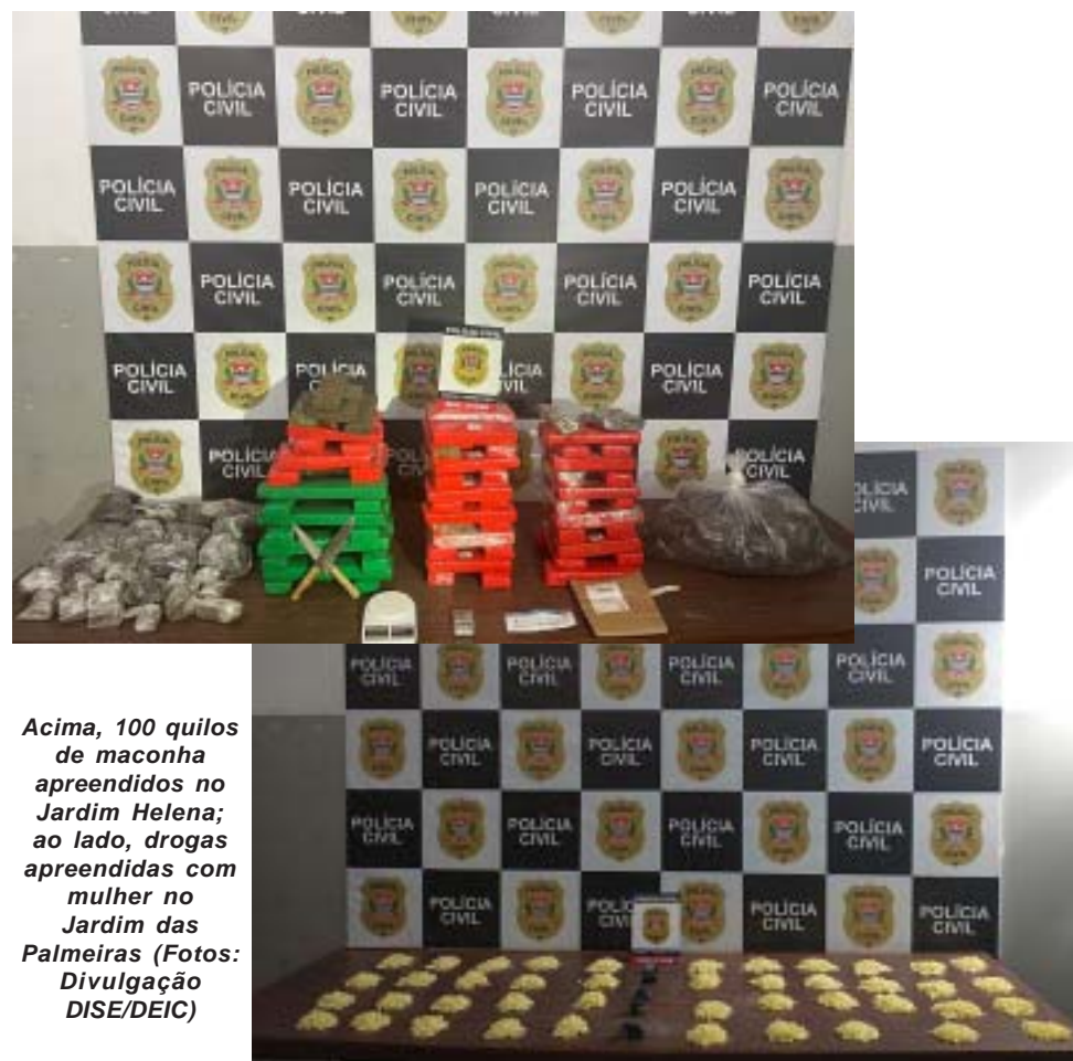
Acima, 100 quilos de maconha apreendidos no Jardim Helena; ao lado, drogas apreendidas com mulher no Jardim das Palmeiras

Os policiais abordaram os suspeitos e encontraram 33 cápsulas com cocaína, 36 pedras de crack, um pedaço de maconha e uma balança de precisão. A dupla admitiu que iria começar a traficar naquele local. A droga foi apreendida e os homens autuados em flagrante. Eles foram encaminhados à cadeia pública de Santa Rosa de Viterbo.