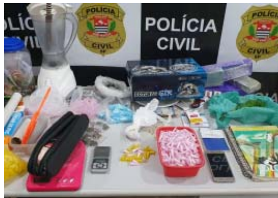
Durante a prisão de dois envolvidos com o tráfico, agentes da DISE de Araraquara encontraram grande quantidade de drogas

Todo o material apreendido foi encaminhado para a sede da especializada, para onde também foram levados os dois homens suspeitos. O material foi encaminhado à perícia e os dois homens foram autuados em flagrante, sendo depois levados a uma unidade prisional, onde permanecerão à disposição da Justiça.