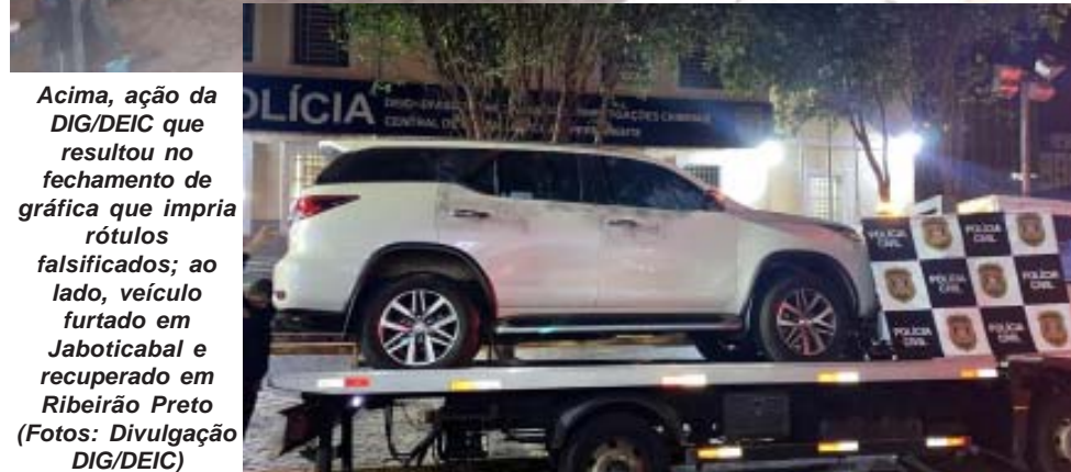
Acima, ação da DIG/DEIC que resultou no fechamento de gráfica que imprime rótulos falsificados; ao lado, veículo furtado em Jaboticabal e recuperado em Ribeirão Preto