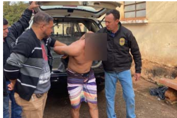
Acima e ao lado, suspeitos de matar idoso na véspera de Natal foram presos por policiais civis da DIG/DISE de Sertãozinho