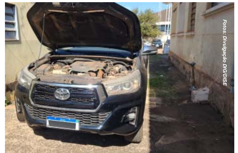
Caminhonete apresentava sinais de adulteração