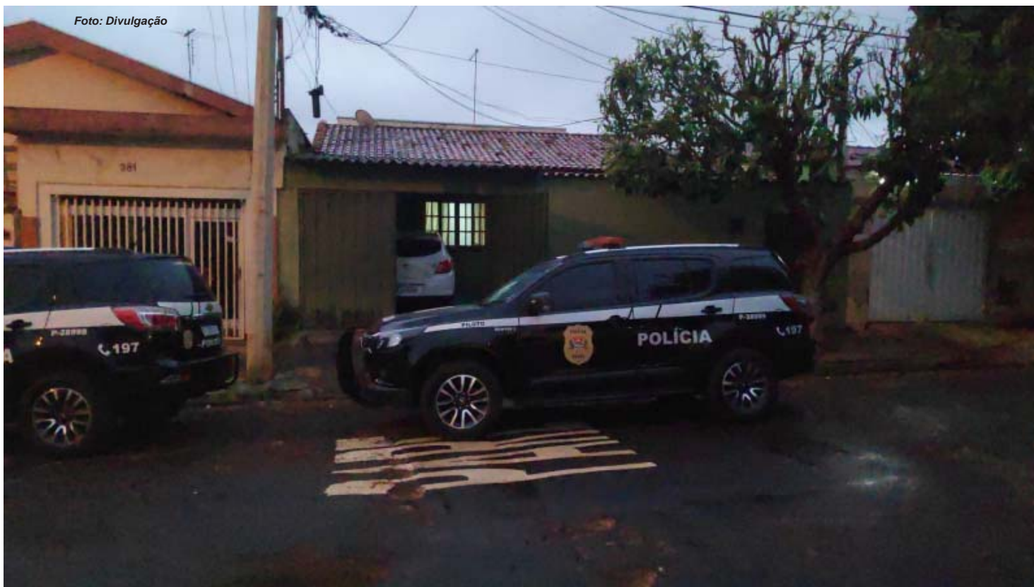
Policiais civis de Cravinhos coordenaram a primeira fase da Operação Ares em três cidades, com apoio da DEIC Ribeirão e de Serrana

No dia 12 de maio, nova ação foi realizada. Na segunda fase da Operação Ares, os policiais civis de Cravinhos contaram com apoio da Polícia Militar para cumprir