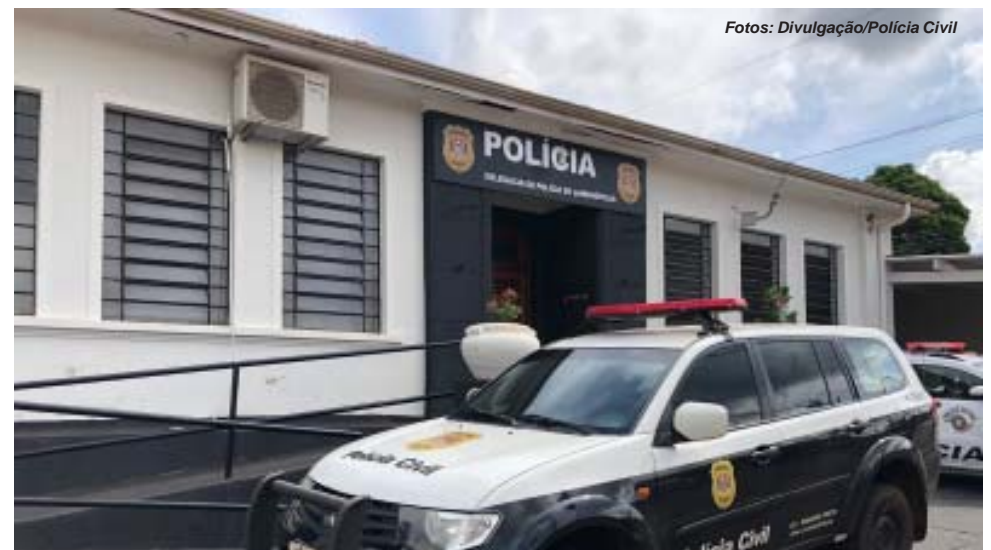
Delegacia de Jardinópolis efetuou prisão de três envolvidos em furto e roubo de caminhonetes de luxo