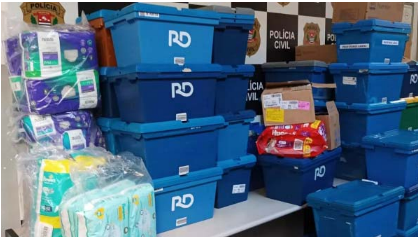
Os policiais civis apreenderam farto material durante a realização da Operação Calibre 12

ções, a Polícia Civil conseguiu estabelecer as funções de cada integrante, desde os líderes, até os responsáveis pela lavagem de dinheiro, passando pelos criminosos que praticavam os assaltos.