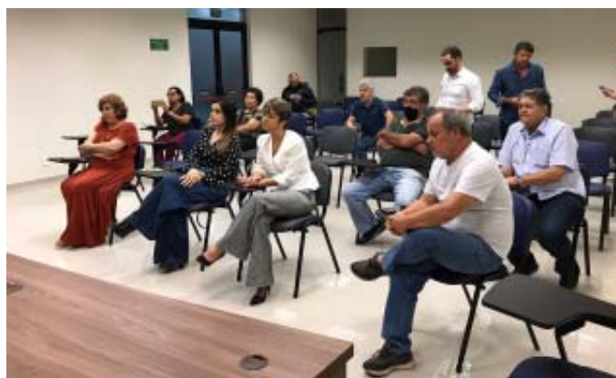
Policiais civis presentes ao encontro