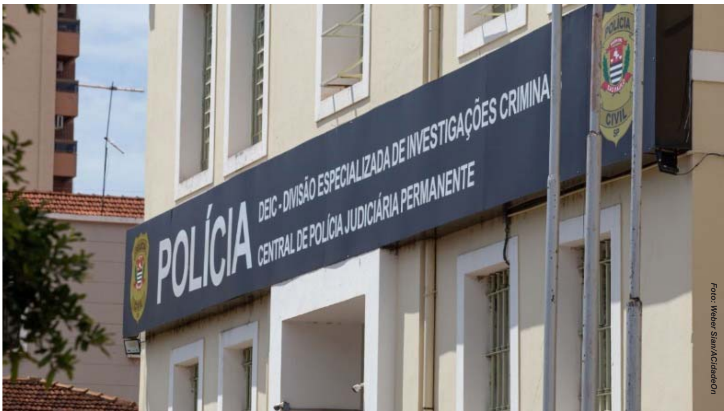
Graças ao trabalho da DIG/DEIC Ribeirão Preto, réu foi condenado pela morte de transexual menos de dois anos depois do crime