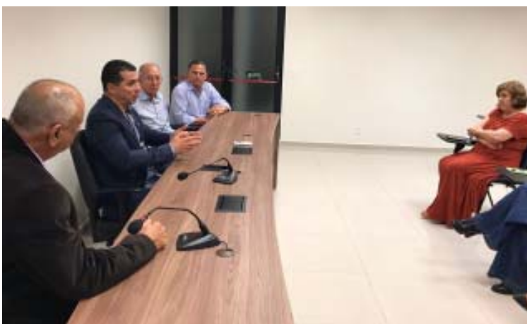
Deputado Luís Miranda se comprometeu a sempre lutar pelos policiais civis no Congresso Federal