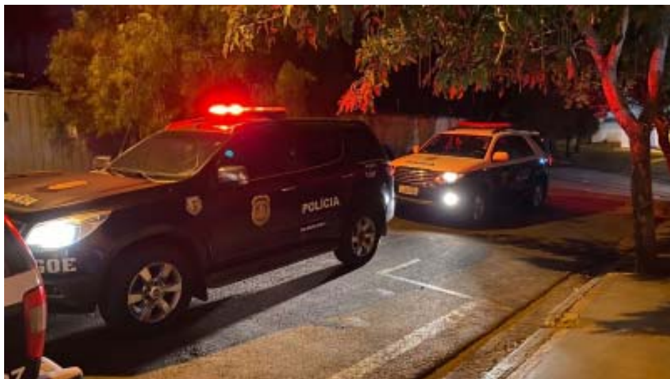
Homem suspeito de pedofilia foi preso em São Carlos durante Operação Skyfall

Uma mulher foi presa, no dia 23 de maio, com uma arma de fogo na Vila Virgínia. Policiais da 1ª DIG/DEIC (Delegacia de Investigações Gerais da Divisão Especializada de Investigações Criminais) da cidade foram até sua residência, na Rua Graça Aranha, para cumprir mandado de busca e apreensão. Durante as buscas, encontraram uma garrucha calibre 32 com munições. A arma estava no quarto em que a mulher dormia e foi apreendida junto com as munições, sendo encaminhadas ao IC (Instituto de Criminalística) para exames periciais. A mulher foi conduzida até a delegacia, onde foi autuada em flagrante por posse irregular de arma de fogo. Pagou R$ 1.300 de fiança e vai responder em liberdade.