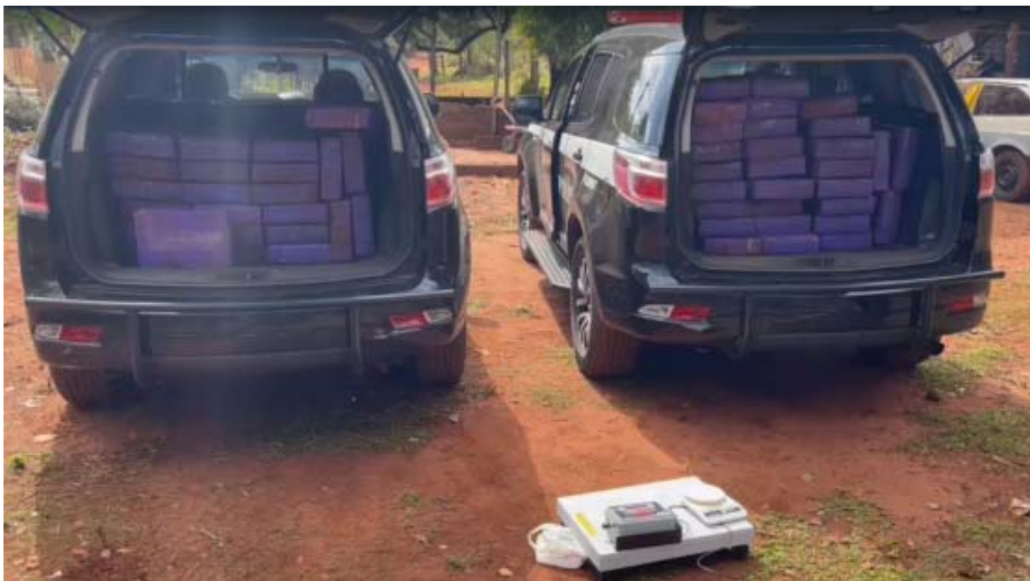
A droga apreendida ocupou os porta malas de duas viaturas da DISE/DEIC de Ribeirão Preto

da propriedade, havia uma área ao lado do muro, com cerca de três metros quadrados. A terra tinha sinais de que havia sido remexida, destoando do terreno restante naquele local. Suspeitaram, então que a droga pudesse estar enterrada.