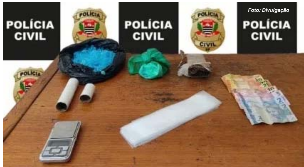
Material apreendido com traficante “investigativo”

Ele deve responder por tráfico de drogas e associação para o tráfico. Sua pena pode chegar a 15 anos de reclusão, caso seja condenado.