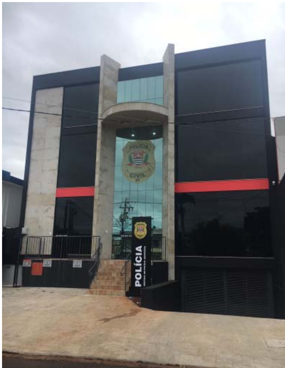
Tanto a CPJ Integrada de Ribeirão Preto (foto), quanto a de Franca contam, cada uma, com 10 investigadores, quando deveriam ter 61 e 37, respectivamente

Principal recurso para solucionar crimes e punir infratores, apuração tem sido prejudicada com a falta de efetivo na Polícia Civil