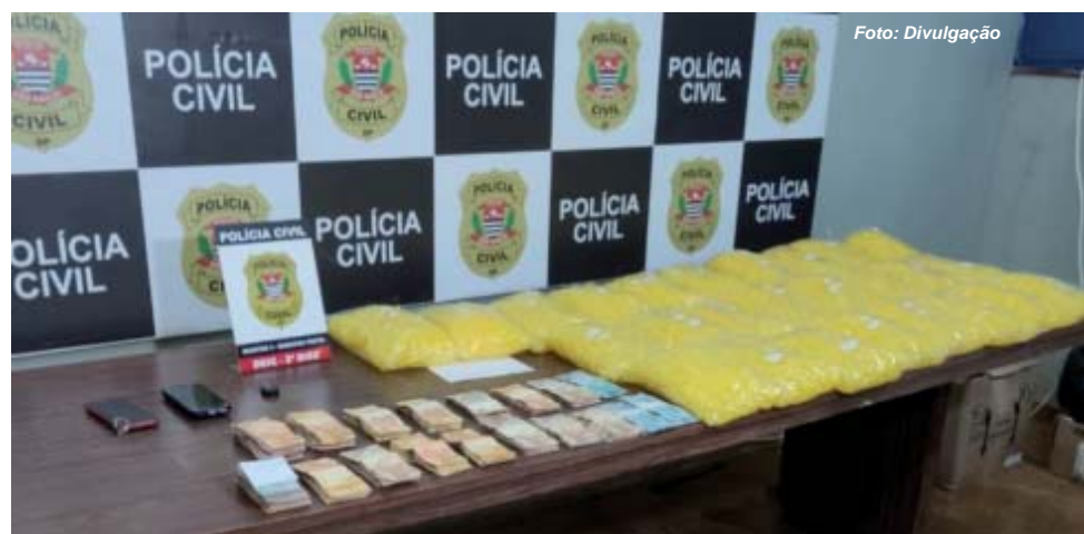
A droga era transportada em fundos falsos de três veículos; policiais civis apreenderam também dinheiro e cápsulas para acondicionamento de mais porções

Os suspeitos foram conduzidos à sede da delegacia especializada, onde foram autuados em flagrante por tráfico e associação para o tráfico, sendo encaminhados ao sistema prisional.