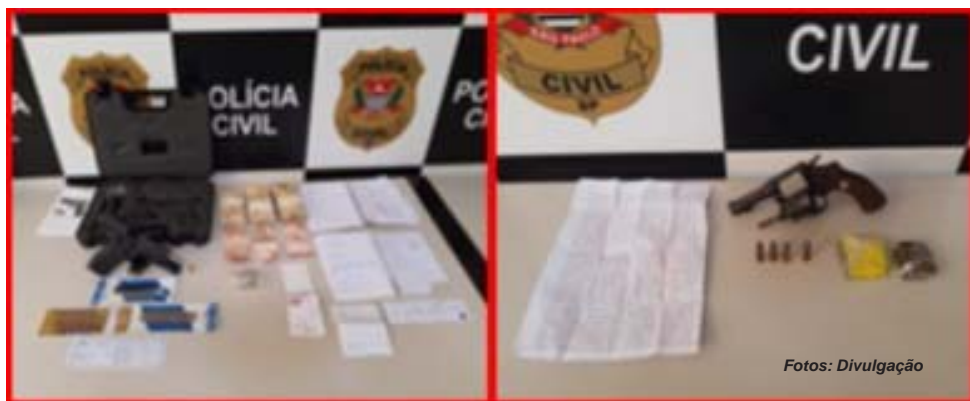
As duas armas foram apreendidas durante ações da DIG/DEIC de Ribeirão Preto

Além da arma apreendida com suspeito de tráfico, os policiais civis ainda encontraram em outra residência pistola calibre 380 com munições e R$ 18 mil em dinheiro