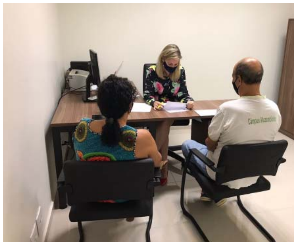
O Departamento Jurídico do Sinpol já está ingressando com ações individuais contra a cobrança considerada indevida na contribuição previdenciária dos aposentados e pensionistas