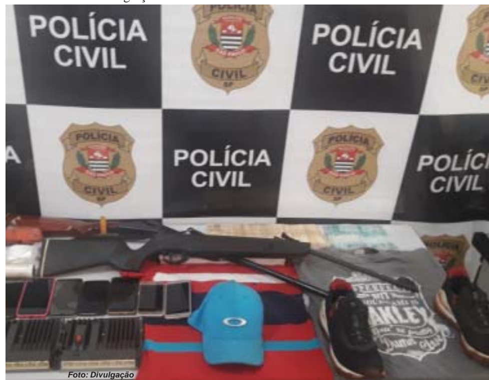
Módulos de ignição e armas apreendidas durante cumprimento dos mandados de busca e apreensão contra suspeitos de participarem do roubo de caminhonete

Feita essa validação, a caminhonete era desmontada. Por último, estes automóveis tinham alguns destinos, como desmanches ou países como Paraguai e Bolívia, onde seriam trocados por drogas. Vale ressaltar que, durante todo o processo de investigação, a Polícia Civil conseguiu recuperar alguns destes veículos.