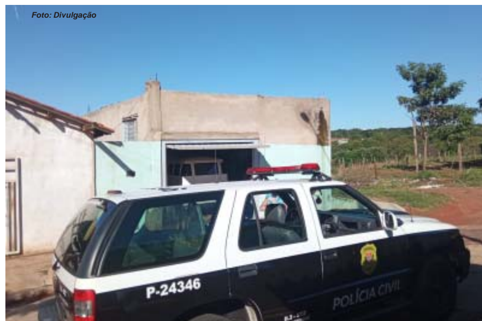
Policiais civis realizaram ação contra receptores e recuperaram 5,5 toneladas de fios furtados

As ações, em geral, têm sido realizadas como a deflagrada pelo SIG de Jaboticabal. Combatendo o receptor, diminuem as possibilidades de venda do produto furtado e, conseqüentemente, deixa de haver interesse no furto e depredação de patrimônios públicos e particulares.