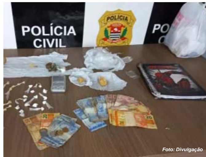
Material apreendido com o trio de traficantes preso pela equipe da especializada de Franca

Os policiais civis apreenderam 51 porções de crack, duas porções de maconha e 13 cápsulas contendo cocaína. Também apreenderam celulares, materiais para o refino e fracionamento da droga, balança de precisão e dinheiro, possivelmente oriundo da venda de substâncias entorpecentes. Toda a droga apreendida e os três homens flagrados no local foram conduzidos para a sede da Delegacia. Os três foram encaminhados ao sistema prisional, onde permanecerão à disposição da Justiça e vão responder por tráfico e associação para o tráfico.