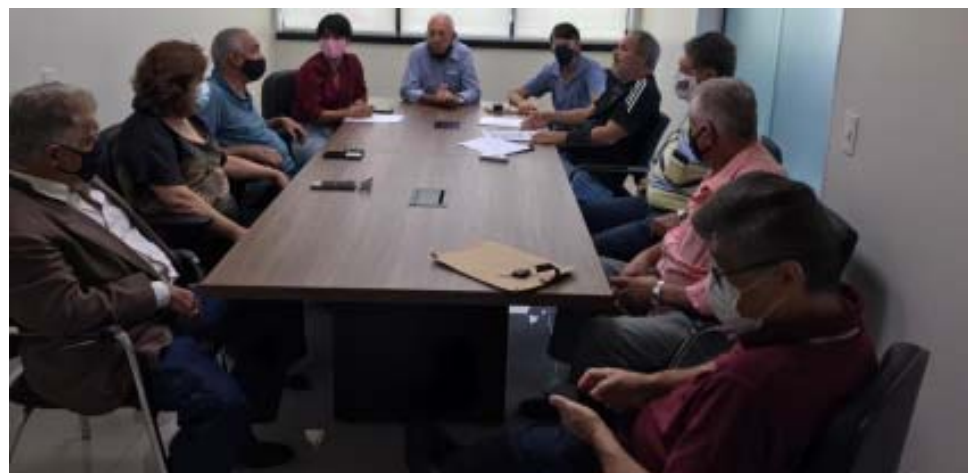
Diretores do sindicato aprovaram o projeto de revitalização do clube de campo

e realização das obras de maior impacto. O processo de revitalização deve ser concluído ainda no primeiro semestre. “Em pouco tempo nossos associados vão poder desfrutar de um espaço que todos adoram, mas totalmente revitalizado”, conclui Célio.