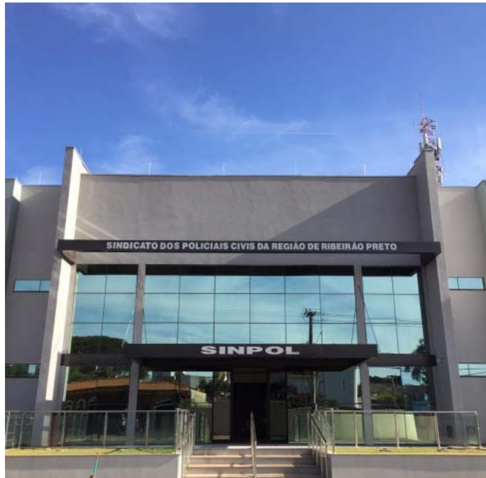
Diante do grande número de reclamações dos conveniados, Sinpol encerrou plano odontológico com o São Francisco Odonto e ampliou com SERMED Odonto