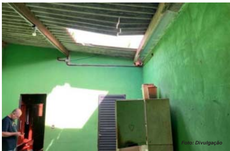
Local onde procurado trapalhão caiu ao tentar fugir dos policiais civis

Homem estava sendo procurado por ter participado de um assalto em uma usina de cana-de-açúcar na região e tentou fugir dos policiais civis