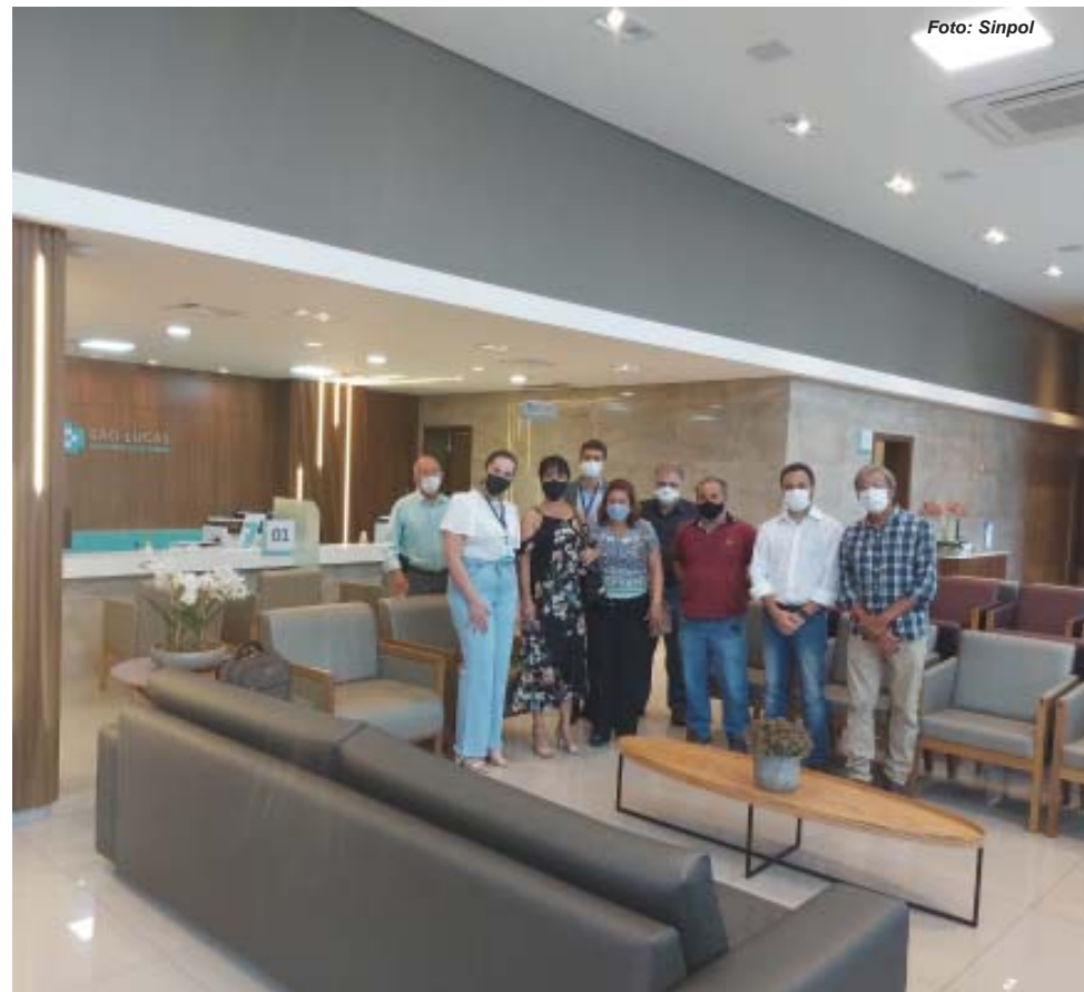
Diretores do Sinpol acompanhados de diretores da Sermed e do São Lucas, durante visita ao hospital localizado na Vila Seixas