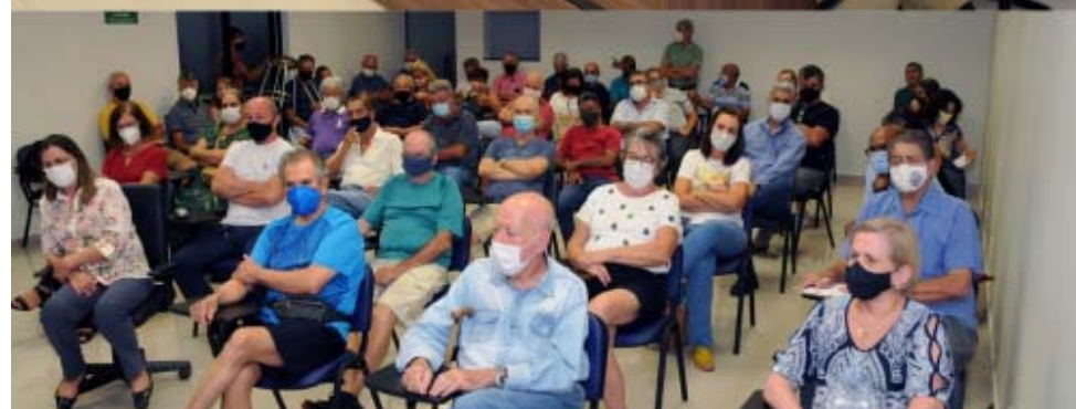
Na foto mais ao alto, Diretores do Sinpol durante assembleia que contou com participação de diretores da SERMED; acima, sindicalizados compareceram em bom número