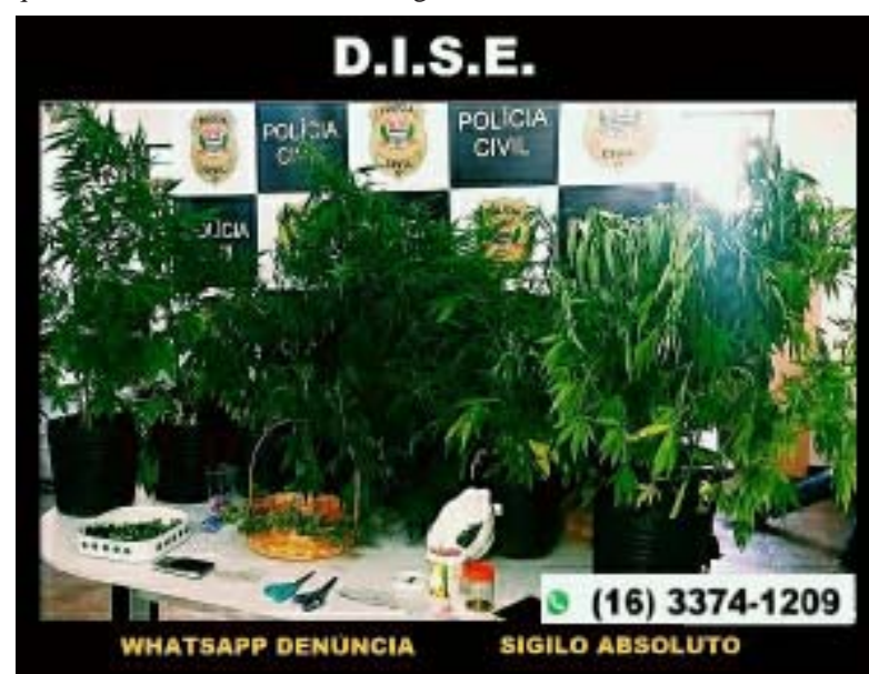
Pés de maconha apreendidos pela DISE de São Carlos durante ação

De acordo com os policiais civis, no local foi encontrada uma parte da droga conhecida por “camarões”. É uma parte da maconha dificilmente encontrada para a venda, diante de seu alto teor de toxicidade. É considerada uma espécie de flor pura da maconha, onde há maior quantidade de substância entorpecente. A equipe da DISE de São Carlos destacou a importância da denúncia. Nos dois casos, os denunciante tiveram seu sigilo mantido e traficantes foram retirados das ruas.