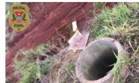
Local onde o corpo foi deixado