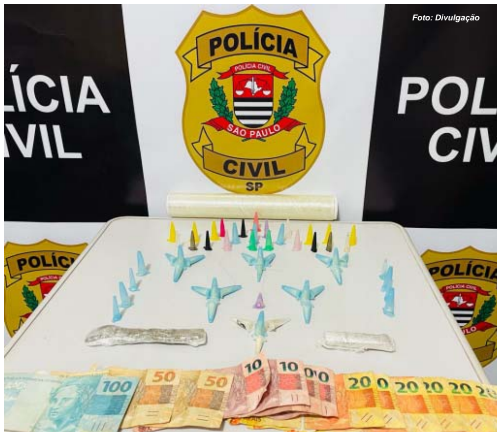
Ação da DISE de Casa Branca realizada em Mococa resultou na apreensão de drogas e dinheiro oriundo do tráfico

Policiais civis que integram a Delegacia de Polícia de Ibaté foram a campo, no dia 02 de setembro, para cumprir um mandado de prisão. O procurado é um homem de 31 anos que foi condenado por tráfico de entorpecentes. De posse do mandado, os policiais civis seguiram até a Rua Ghelindo Thamos, no Jardim Icarai, periferia de Ibaté, onde encontraram o fugitivo da Justiça. Ele não esboçou reação e acabou