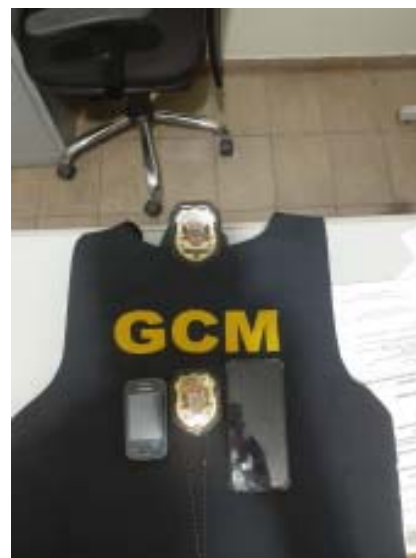
Materiais apreendidos em ações conjuntas realizadas entre policiais civis e GCMs de Tapiratiba

Outro mandado de prisão foi cumprido no dia 17 de setembro. Na ocasião, JBF acabou sendo capturado. Contra ele havia o mandado de prisão criminal. Por se tratar de sentença a Regime Aberto, o indigitado foi conduzido ao Cartório Criminal da Comarca para audiência de admoestação.