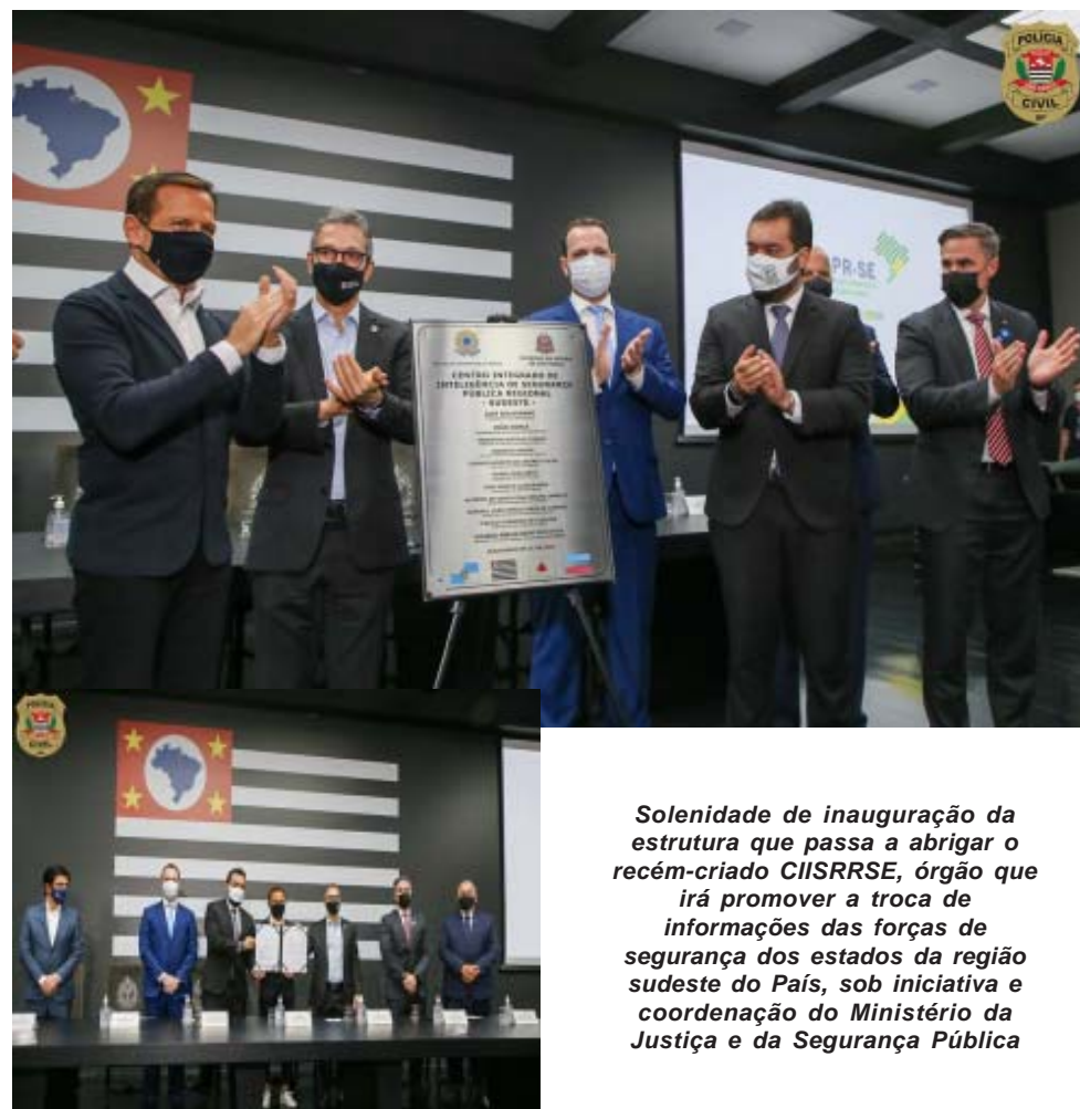
Solenidade de inauguração da estrutura que passa a abrigar o recém-criado CIISRRSE, órgão que irá promover a troca de informações das forças de segurança dos estados da região sudeste do País, sob iniciativa e coordenação do Ministério da Justiça e da Segurança Pública

Por: Nathalia Pagliarini - SSP/SP, com adaptações e acréscimo