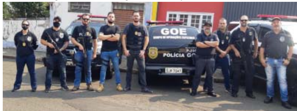
Acima: equipe do GOE em ação conjunta na cidade de Dourado; abaixo, DISE de São Carlos apreendeu mais de 200 porções de drogas em patrulhamento preventivo

Nesta operação, seis pessoas acabaram presas e indiciadas pelo artigo 33 da Lei 12343/06, combinado com o artigo 35 da mesma Lei. Todo o material apreendido e os detidos na operação foram encaminhados à Delegacia de Dourado, onde receberam voz de prisão em flagrante. Após a conclusão dos trabalhos de Polícia Judiciária, os seis indiciados foram encaminhados ao Centro de Triagem de São Carlos, permanecendo à disposição da Justiça.