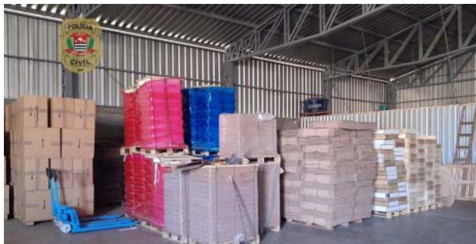
Cigarros falsificados apreendidos por policiais civis em galpão instalado na zona Rural de Cássia dos Coqueiros

Ele disse ainda que as investigações prosseguem, pois os outros suspeitos estão foragidos. A Polícia Militar chegou a realizar um cerco na região, mas não conseguiu encontrar os envolvidos. A contabilidade indicando a produção de milhares de maços por dia foi encontrada e um caminhão e uma caminhoneira foram apreendidos no local.