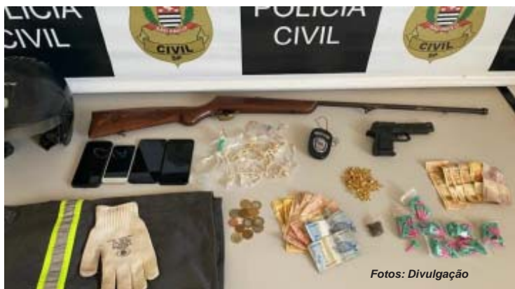
Graças à ação do SIG de Ribeirão Bonito, três homens acabaram presos e policiais civis apreenderam armas, drogas e outros objetos provenientes dos roubos cometidos pelo grupo