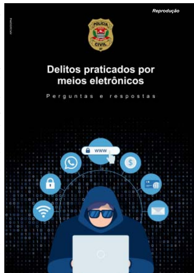
Capa da cartilha digital que alerta sobre golpes por meios eletrônicos, disponível no site da SSP

Por: Paula Vieira - SSP/SP, com adaptações