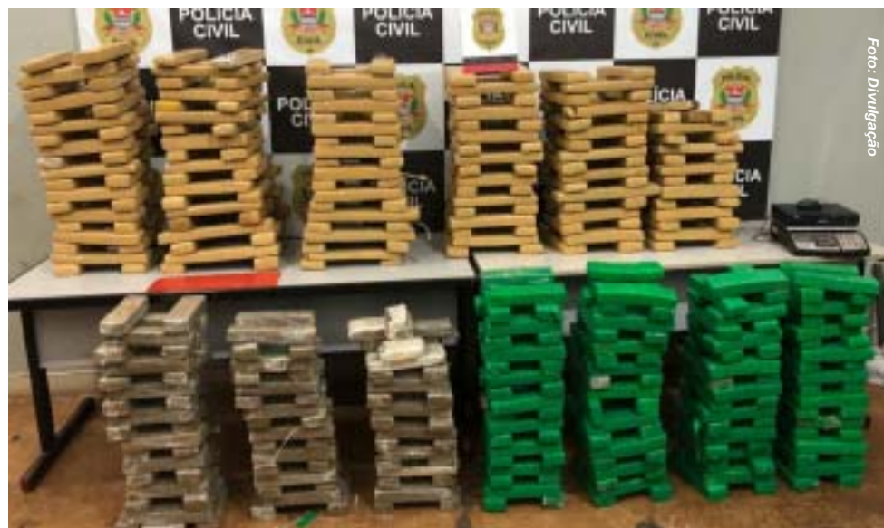
Mais de 450 tijolos de maconha apreendidos em uma única operação da DISE/DEIC