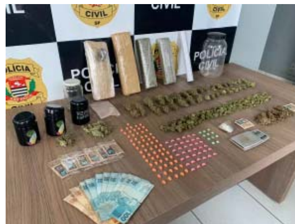
Acima, drogas apreendidas pela DISE de Franca com homem que seria o "traficante das baladas" e usava marketing dizendo ser a melhor e mais pura droga da região; ao lado, DIG de Franca localizou e fechou bingo clandestino

Segundo ele, após receberem denúncias, os policiais civis constataram a ilegalidade do estabelecimento e, com mandado de busca e apreensão, foram até o local e fecharam o "comércio". A proprietária, uma senhora de 73 anos, foi levada até a sede da especializada, onde foi autuada e vai responder pela contração de jogo de azar. No momento da ação, não havia clientes no local e cinco máquinas caça-níqueis que estavam em funcionamento foram apreendidas.