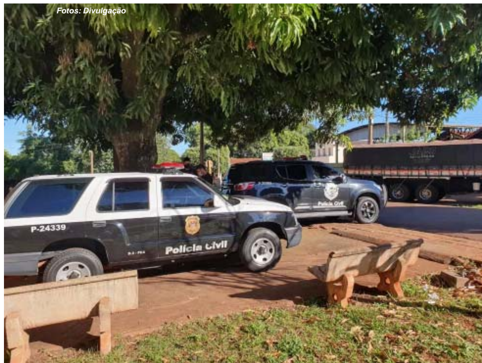
Polícia Civil realizou, em Miguelópolis, ação contra suspeitos de pedofilia