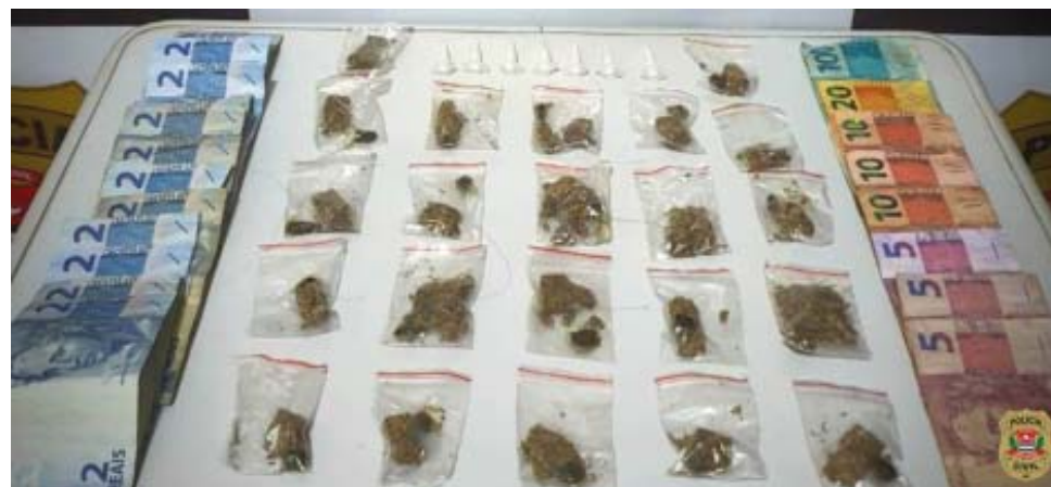
Drogas apreendidas em Santa Cruz das Palmeiras