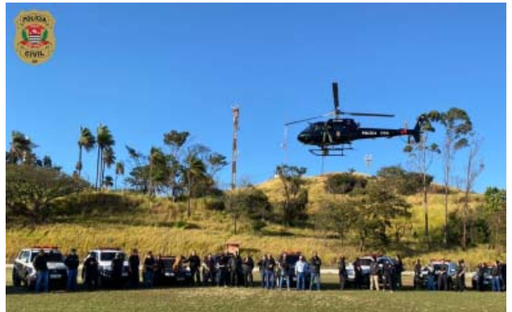
Equipes reunidas para a Operação Redenção em São José do Rio Pardo