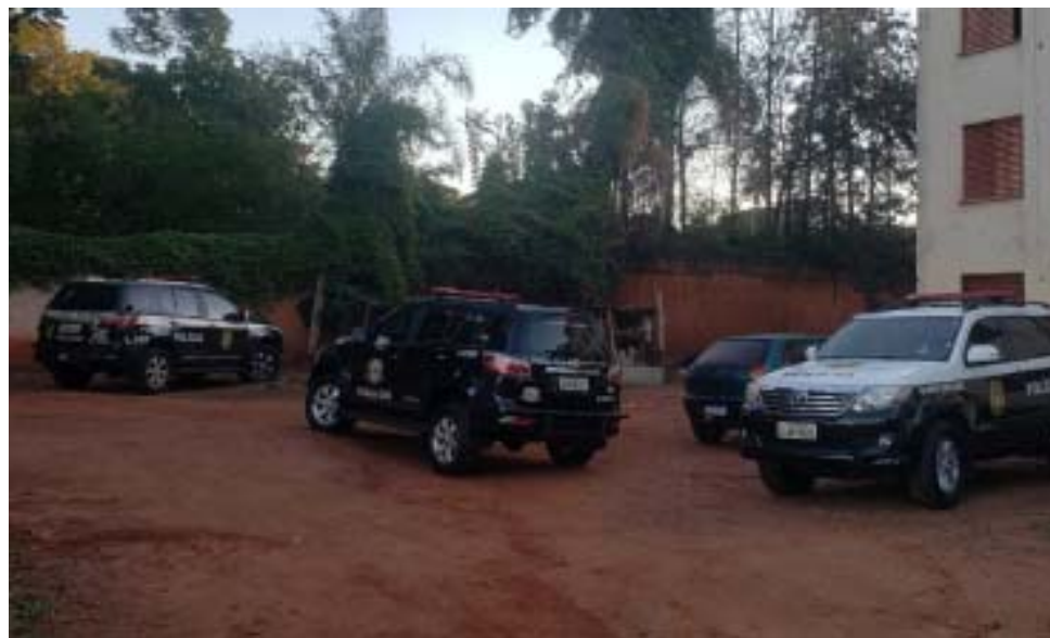
Força tarefa cumpriu 15 mandados de busca e apreensão e 14 mandados de prisão nesta segunda fase da Operação Éfodo

No total, participaram da operação 80 policiais civis paulistas, além dos policiais civis mineiros e dos integrantes do Canil da SAP em Ribeirão Preto. Apesar das prisões efetuadas, as investigações prosseguem e não está descartada novas etapas da Operação Éfodo.