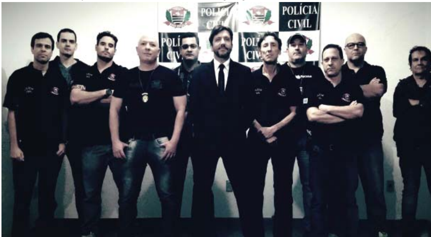
Equipe da DIG de São Carlos, em foto de arquivo: mais um homicídio rapidamente esclarecido pela especializada

Como ainda existem algumas contradições nos depoimentos do acusado e do adolescente, o caso prossegue. Segundo o dr. Aquino, as investigações continuam até que tudo seja devidamente esclarecido.