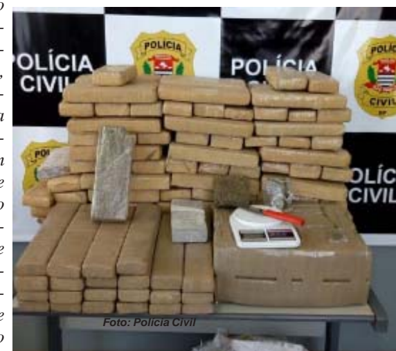
Droga apreendida em Franca durante o mês de agosto e que foi incinerada no início de setembro

A Polícia Civil realizou, em 04 de setembro, a incineração de aproximadamente 200 quilos de drogas recolhidos no mês agosto, no município de Franca. A destruição dos entorpecentes - crack, cocaína, maconha e LSD - foi viabilizada pela Delegacia de Investigações Sobre Entorpecentes (DISE) e ocorreu em forno de alta temperatura, em uma empresa na cidade. O procedimento teve regular autorização da Justiça, nos termos da legislação em vigor, em especial a Lei nº 11.343/06 (Lei de Drogas) e contou com a participação de representantes da Polícia Civil, Ministério Público e Vigilância Sanitária.