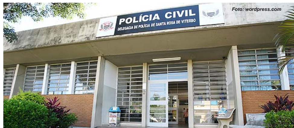
Fachada da Delegacia de Polícia de Santa Rosa de Viterbo

As buscas continuaram e, no dia 25 de agosto, ele foi localizado e preso. Estava escondido em uma região agrícola, na zona rural de Santa Rosa de Viterbo. Ele teve a prisão preventiva decretada e vai responder pela morte da ex-companheira.