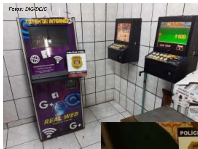
DIG/DEIC apreendeu cédulas falsificadas e localizou máquinas de jogos de azar, que também foram apreendidas

Levada até a sede da especializada, a mulher informou que apenas guardava as drogas para outra pessoa. De qualquer forma, ela foi presa em flagrante por tráfico e associação para o tráfico. As investigações prosseguem para identificar outros possíveis envolvidos.