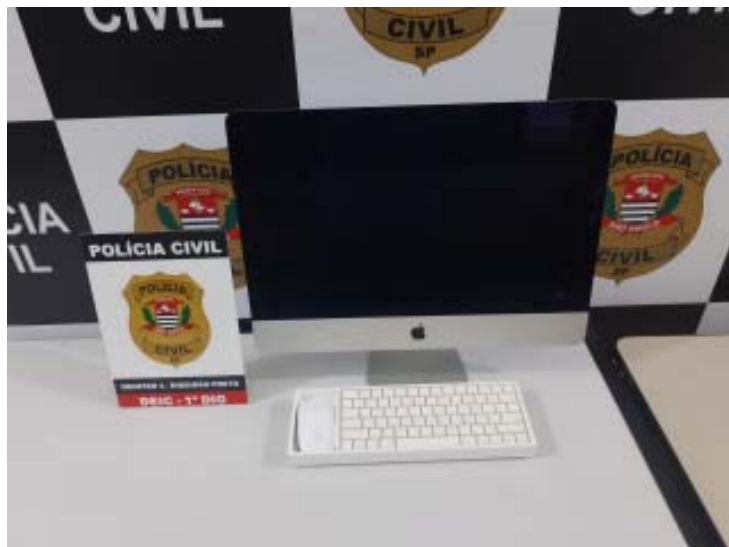
Investigações levaram homem à prisão por receptação após comprar produto furtado em negociação pela internet

Durante as diligências, os policiais civis conseguiram localizar e apreender o computador, um teclado e um mouse furtados na cidade de São Joaquim da Barra. O equipamento foi restituído a seu verdadeiro dono. Além disso, os policiais civis encontraram dois aparelhos celulares na posse do acusado, que também foram recolhidos para análise. O homem foi preso em flagrante e indiciado. Irá responder por receptação qualificada. Ele foi encaminhado ao sistema prisional e segue à disposição da Justiça.