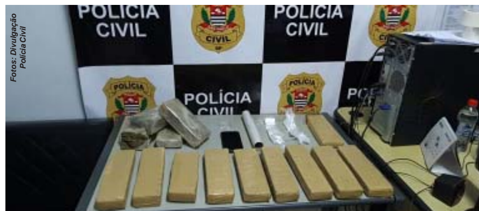
Policiais civis da DISE de Franca apreenderam grande quantidade de maconha