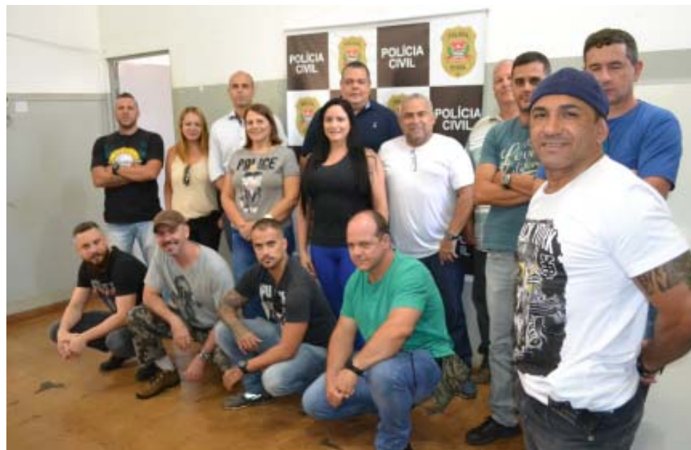
Policiais civis da DISE/DEIC tiveram um intenso trabalho e realizaram grandes apreensões, além de diversas prisões de acusados de tráfico