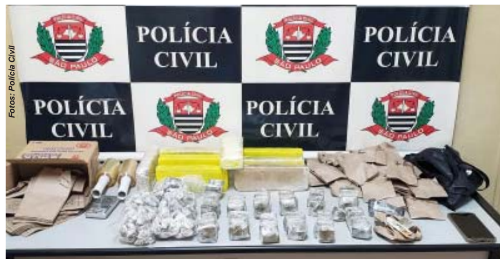
Acima, droga apreendida junto a traficante que agia no sistema “delivery”; abaixo, droga encontrada na casa de traficante que cultivava maconha

O suspeito foi conduzido à sede da especializada, onde foi autuado em flagrante e encaminhado ao sistema prisional, onde permanecerá à disposição da Justiça. A droga apreendida foi encaminhada à perícia.