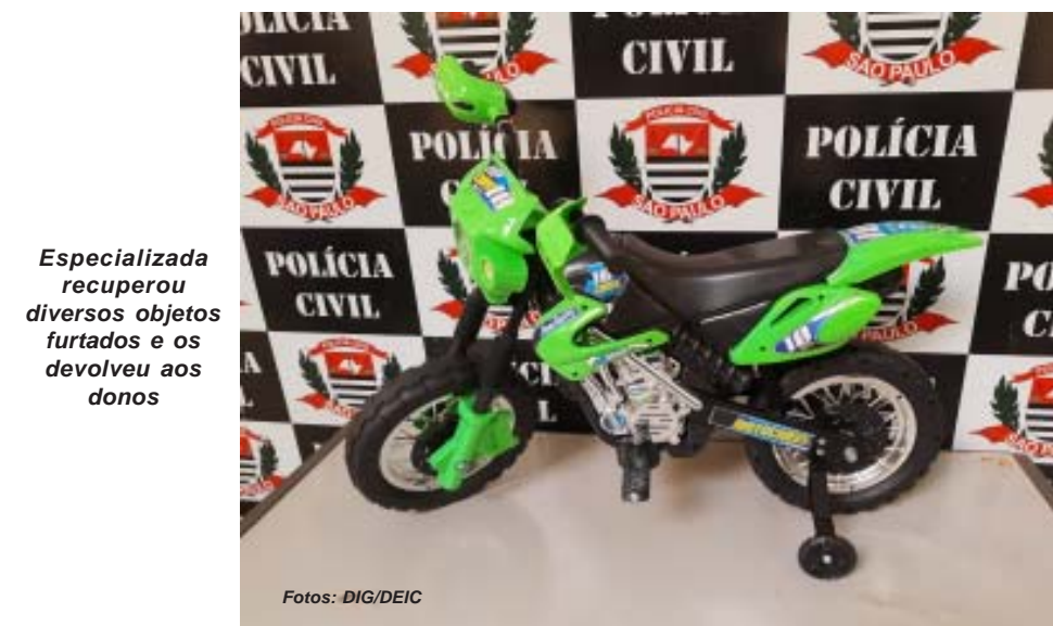
Especializada recuperou diversos objetos furtados e os devolveu aos donos