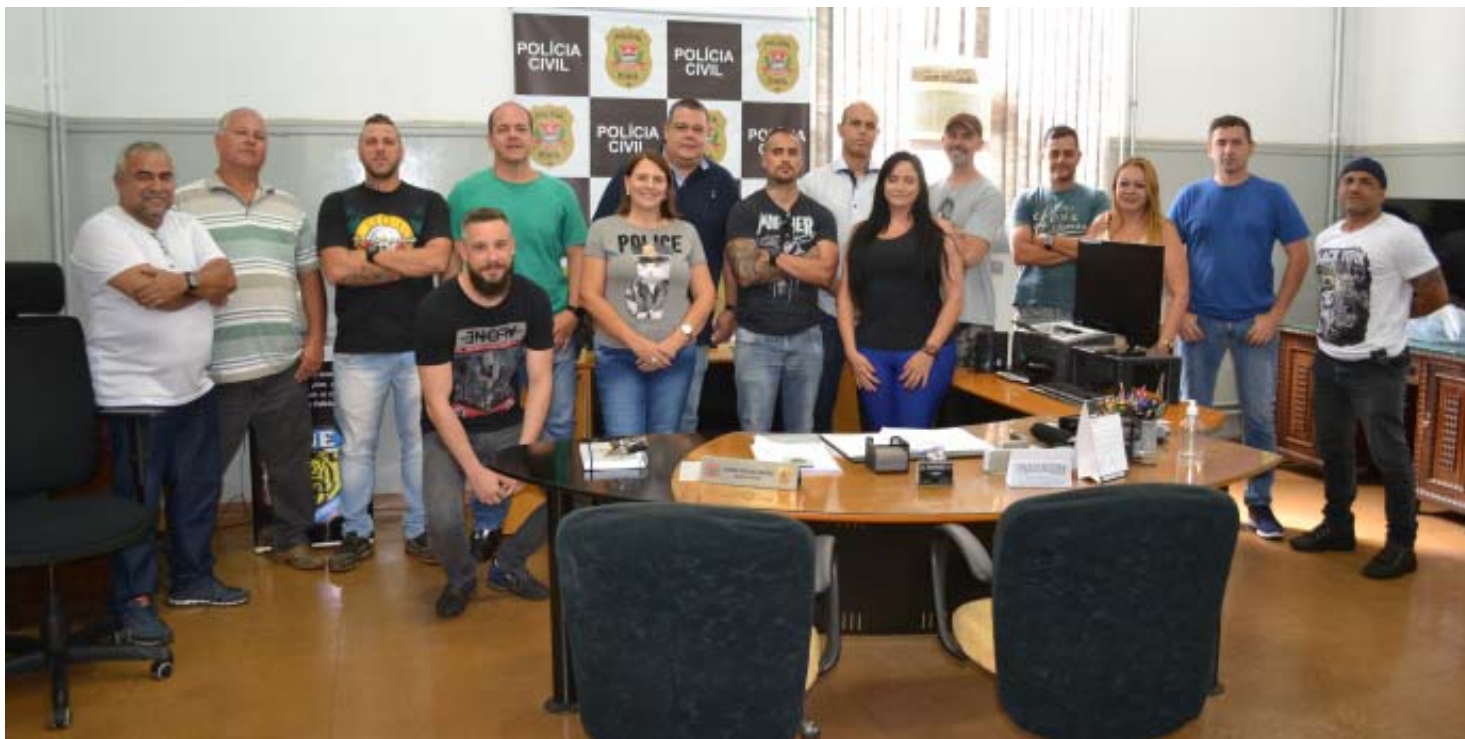
Equipe da DISE/DEIC de Ribeirão Preto, que tem atuado com eficiência no combate ao crime organizado