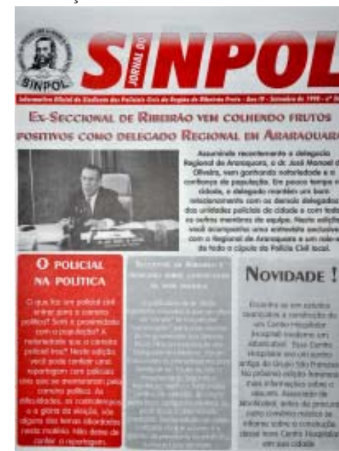
Reprodução da capa da edição 36, que circulou em setembro de 1998