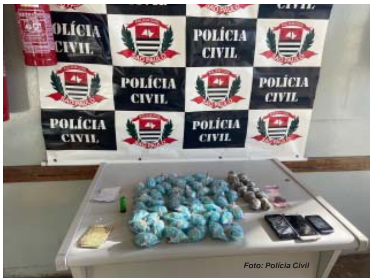
Um servente de pedreiro foi flagrado com drogas em Santa Rosa de Viterbo e acabou preso em flagrante

A DDM (Delegacia de Defesa da Mulher) continua realizando atendimento presencial, mesmo durante a pandemia do Covid-19 (novo coronavírus). Mas o atendimento limita-se aos casos de violência doméstica. Em entrevista a jornalistas, a delegada da unidade, dra. Denise Polizelli, informou que durante a quarentena é comum o aumento dos conflitos familiares devido à alteração da dinâmica familiar. “Estamos funcionando normalmente, porém seguindo a recomendação do governo, presencialmente estamos atendendo somente casos de violência doméstica, violência sexual, situações flagranciais e crimes graves. Ou seja, casos em que ocorre entre pessoas de uma mesma família, que moram na mesma casa, mesmo não sendo parentes ou com íntimo vínculo, como namorados”, explicou a delegada.