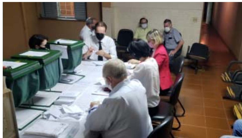
Mesmo em tempos de pandemia, apuração transcorreu observando as recomendações de uso de máscaras, para cumprir o processo democrático