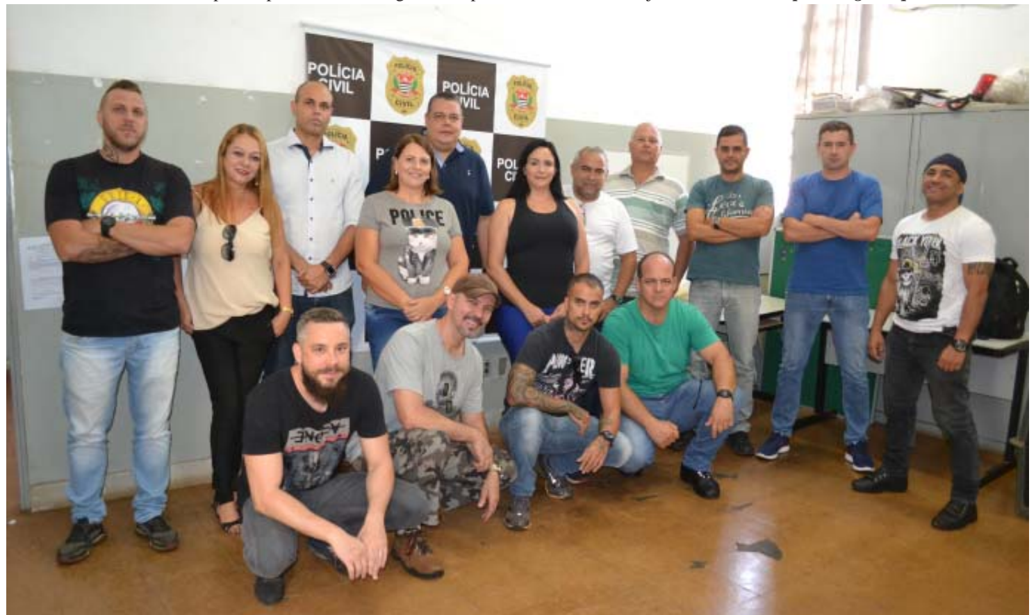
Equipe da DISE/DEIC de Ribeirão Preto, que realizou grandes ações no combate ao tráfico de entorpecentes