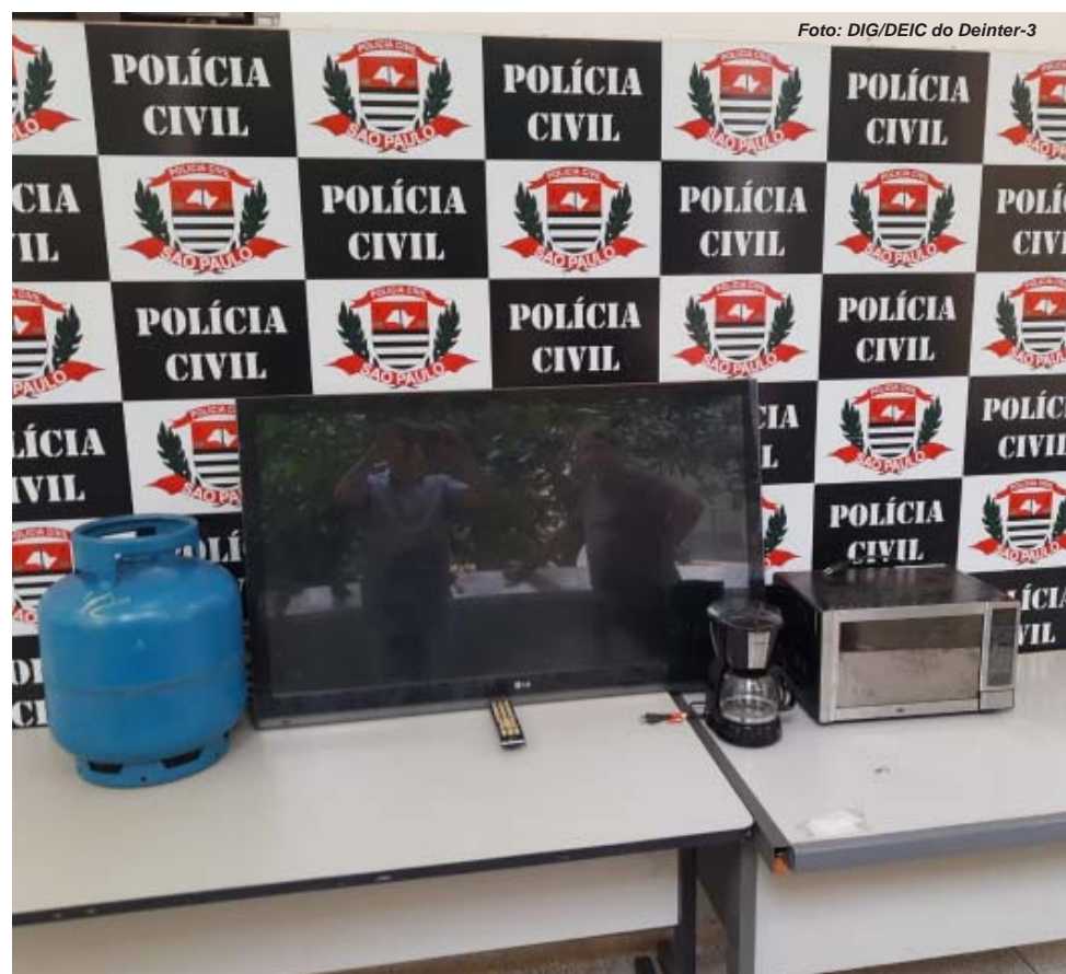
Objetos roubados de idosa assassinada por homem que não retornou da "saidinha" de Natal ao presídio onde cumpria pena por latrocínio